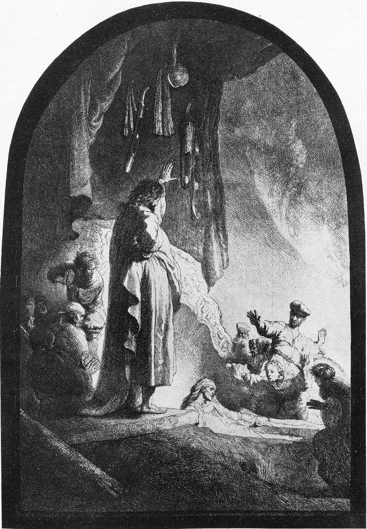
Die Auferstehung des Lazarus. Von Rembrandt.