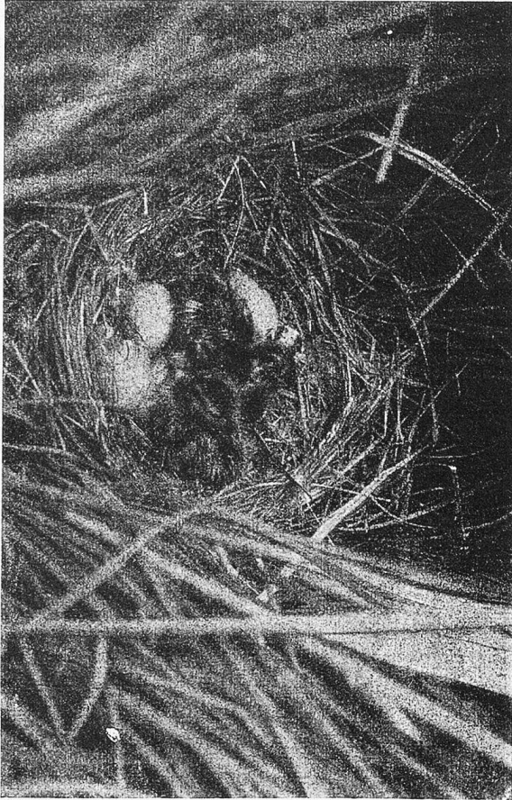
Auschlüpfende Stodkenten im Niedgrasbusch.

Vögel hinter's Licht zu führen. Ein Zelt, das in nächster Nähe der Vormürfe — hier hauptsächlich Nester mit ihrem Inhalt, Eier, Jungen und Alten — aufgestellt werden konnte, diente dem Bildner als Versteck, von dem aus die gewünschten Beobachtungen und Aufnahmen erfolgen konnten. Aber als er anfänglich dieses Zelt bezog, sah er sich in seinen Erwartungen getäuscht; die Vögel spürten die Nähe des Inzassens und hielten sich fern! So mußte er zu der List Zuflucht nehmen, sich durch eine zweite Person einschließen zu lassen. Wenn die Vögel diese sich entfernen sahen, fühlten sie sich erst sicher und nahmen ihre gewohnte Tätigkeit wieder auf.