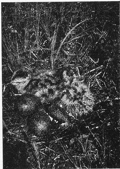
Brachvogeljunges, 2 bis 3 Stunden nach dem Ausschlüpfen.

Jede Zeile darin legt Zeugnis ab von der Hingabe und Begeisterung des Forschers für seine Lieblinge, die uns in ansprechenden Schilderungen wie in prächtigen Lichtbildern nach dem Leben vor Augen geführt werden. Nur diese letztern bedeuten schon eine anerkennenswerte Leistung. Ein Uneingeweihter kann sich kaum einen Begriff davon machen, wie schwer es ist, diese scheuen und beweglichen Lebewesen in befriedigender Art auf die photographische Platte zu bringen. Dafür war es nötig, die