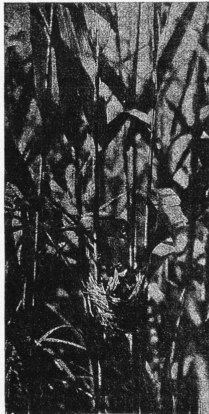
Leichrohrsänger füttert die Jungen.

Das Interesse für dieses Gebiet ist aber hauptsächlich dadurch geweckt worden, daß seine Vogelwelt einen Erforscher gefunden hat, dessen Tätigkeit geradezu vorbildlich bezeichnet zu werden verdient. Die Frucht seiner langjährigen Untersuchungen, die ein gewaltiges Maß von Zeit, Mühen und andern Opfern erforderte, oft genug auch von erfolglosen Anstrengungen