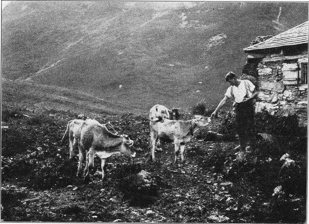
Auf der Baumgartenalp.

zu und gab ihm die Hand. Die Stumpfnase unter der Brille und die Augen, die über diese hinauslugten, bekundeten gleich eifrige Freundlichkeit. Er wisse von Elisen, begann er, daß Magnus heute da und was ihm großes begegnet sei. Da hätte er sich nicht enthalten können, ihn zu begrüßen und ihm Glück zu wünschen.