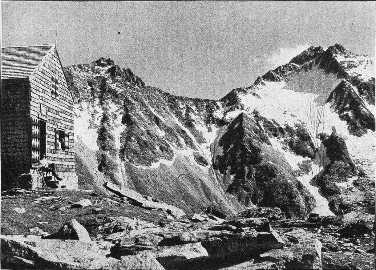
Der Winterstock (3231 m) und Winterlücke, mitunter gefährlicher Übergang zur Albert Heim-Hütte, von der Dammhütte (Uri) gesehen.

Eindringlich sprach ihm Magnus weiter zu.