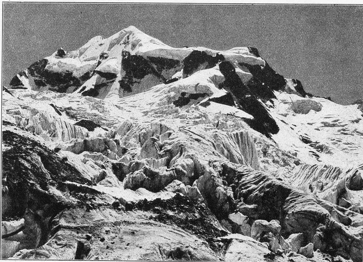
Am Tschiervagletscher, hinten Biz Rosseg (Ober-Engadin).

Kurz bevor es auch für ihn Zeit geworden wäre, sich auf seiner Schreibstube zu melden, trat die Lucretia Blank aus ihrer Tür. Sie erblickte ihn sogleich und kam auf ihn zu. Sie sah ihn scharf, dann erschreckt, dann mit Tränen in den Augen an.