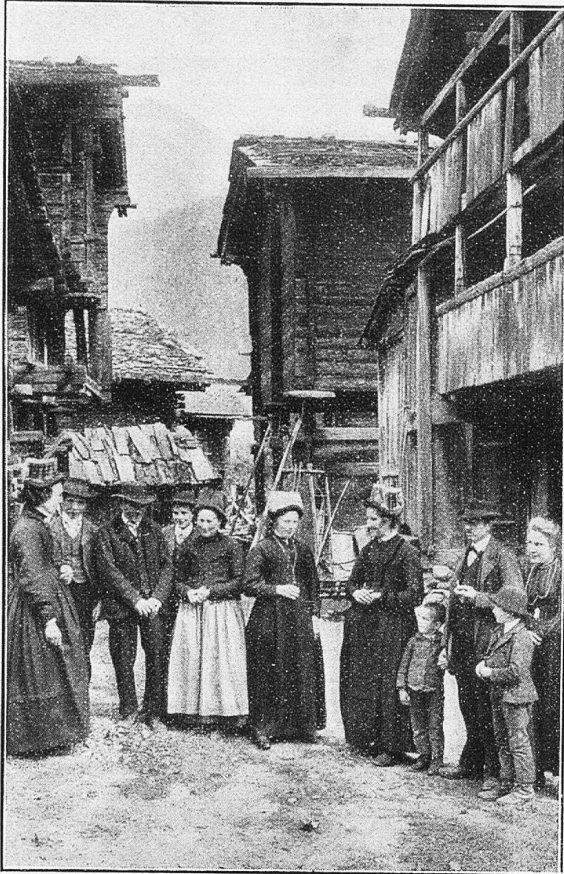
Gomser im Sonntagsstaat.

gib uns Gnade, daß wir sie zu deiner Ehre gebrauchen durch unsern Herrn Jesus Christus, Amen." Nach dem Essen: „Herrgott, himmlischer Vater, wir sagen Dir Dank für alle Speis und Trank, die wir von deiner großen Güte empfangen haben, gib uns Gnade, daß wir sie zu deiner Ehre gebrauchen durch unsern