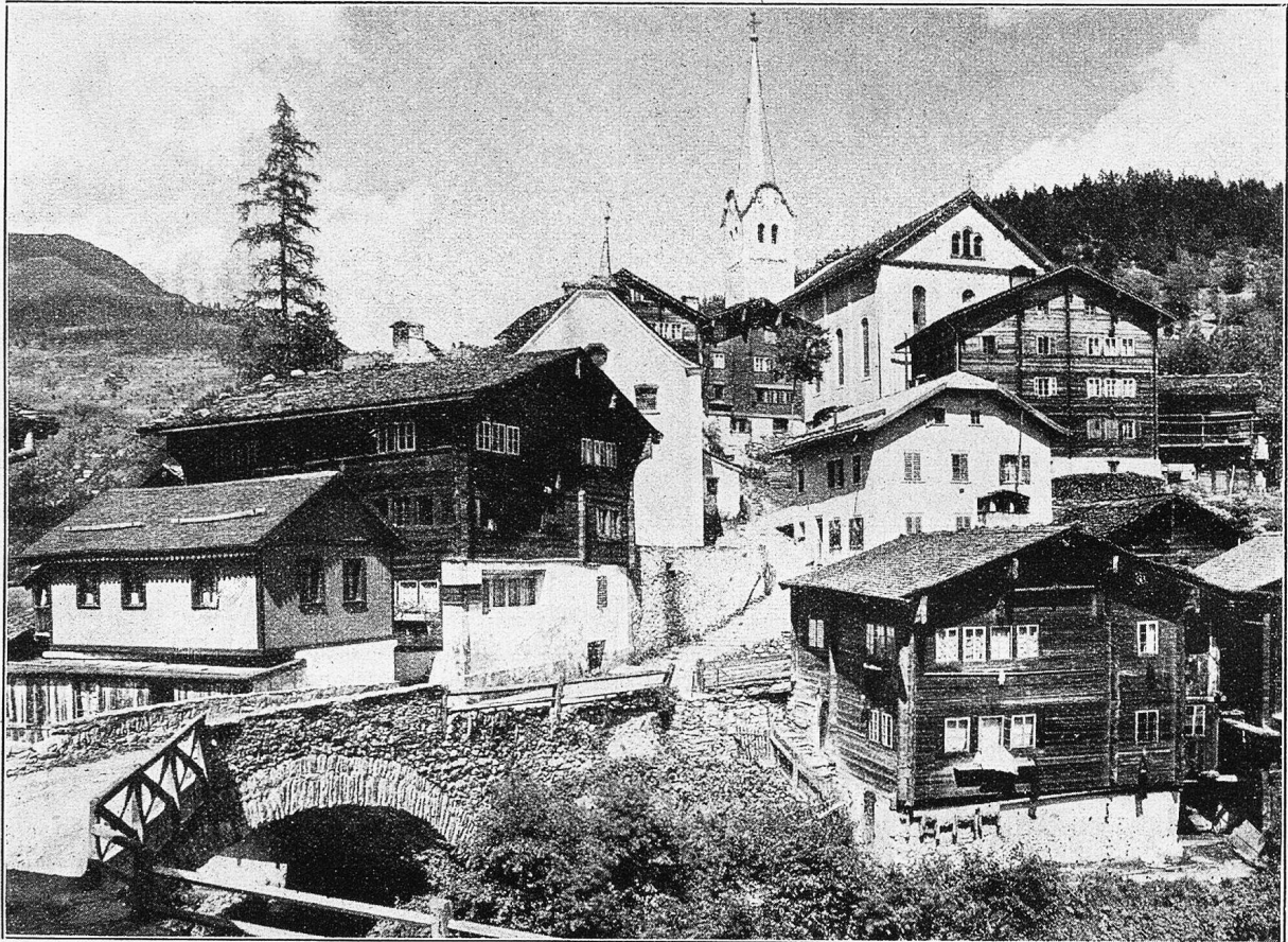
Dorfteil von Fiesch mit Kirche und Brücke über den Fieschertalbach.

durchschnittlich acht bis zehn Wochen dauert, backt eine Haushaltung je nach der Anzahl der Familienglieder vierzig bis neunzig Brote auf ein Mal und bewahrt dieselben nebst Fleisch, Mehl und Käse in den Speichern, in trockenen kellerartigen Räumen oder in den sog. „Läubelti“ (Räumen im Dachgeschoß oder obersten Stockwerk) auf. Seit einigen Jahren befindet sich in Münster eine Weißbrotbäckerei, die