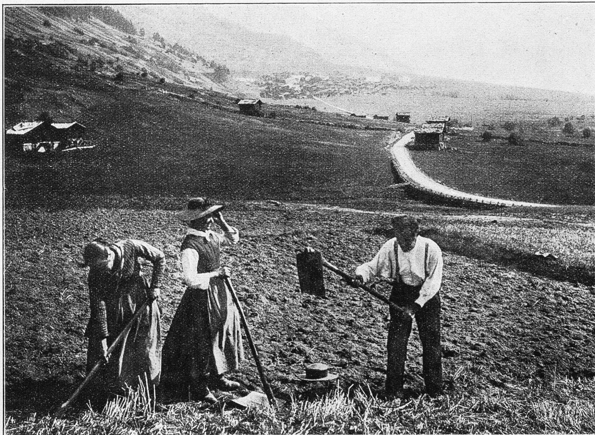
Gomser Bauersleute beim Umgraben des Ackerfeldes mit der Breithaue. Der Pflug wird im Goms nicht verwendet. Im Hintergrund Münster.

Die Haber-suppe soll ganz in Abgang gekommen sein. Zu Mittag isst man Schaf-, Ziegen- oder Schweinefleisch, Brot, Reis oder Kartoffeln und Gemüse und trinkt dazu Schwarztee, schwarzen Kaffee oder Milch. Der „3'U bet“ (nachmittags 3 Uhr) besteht aus Milchkaffee, Brot und Käse und das Nachessen aus Minestra, einer Suppe, in der man Kartoffeln, Reis und gelegentlich auch Gemüse