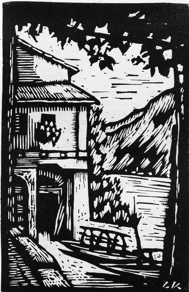
G. Reel: Gandria.