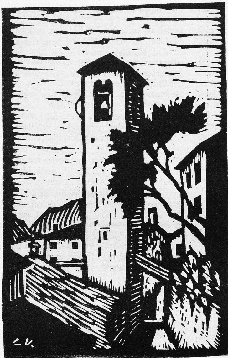
E. Keel: Gandria.

dem neugierigen und lüfternen Doktor angehängte Pöffe aufnahm.