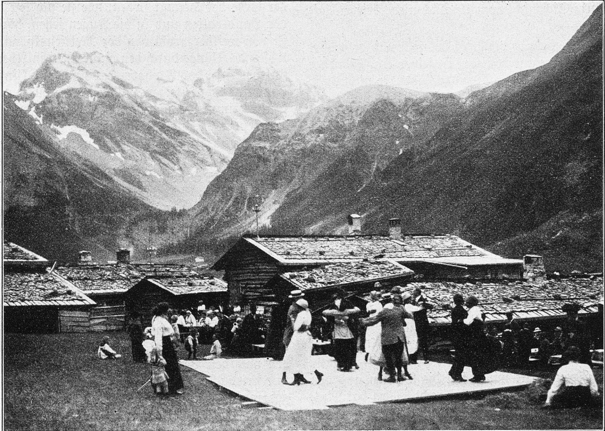
Feuersonntag im Sertig, Tanzvergügen.

Ein Felsblock hat sich vom Lauberhorn losgelöst und nun liegt der Ziegenstall als müster Schutthaufen in Trümmer zerschlagen da.