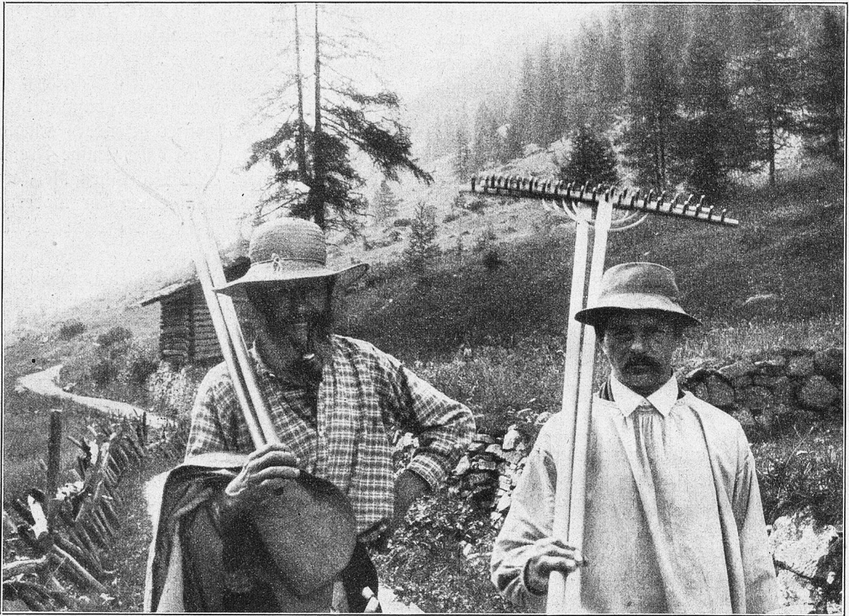
Typische Bündner Bauern im Heuet.

Nach herrlichen Wochen des schönsten Wetters ist es auf einmal unheimlich schwül geworden. Den Bergen entlang schleichen weiße Nebelflecken und über dem Mittagshorn stehen unbeweglich still zwei Fischwolken, die nahendes