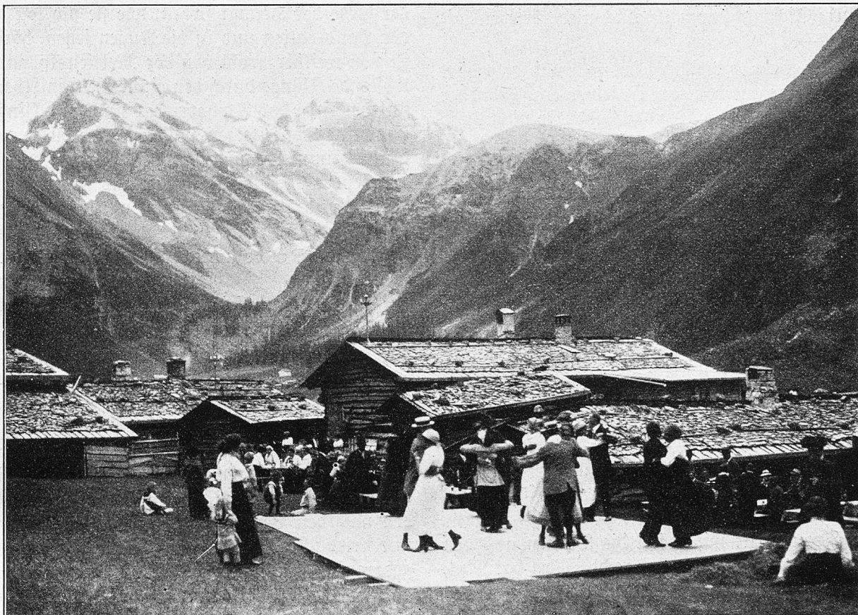
Feuersonntag im Sertig, Tanzvergüßen.

Ein Felsblock hat sich vom Lauberhorn losgelöst und nun liegt der Ziegenstall als müster Schutthaufen in Trümmer zerschlagen da.