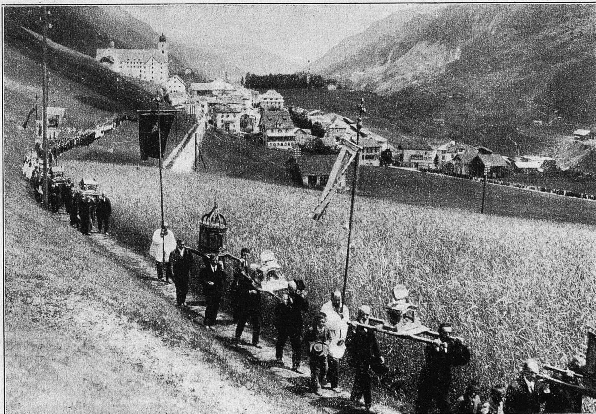
Plazidus-Prozession in Disentis.

Schnurgerade, wie die neuen Seile, an de-