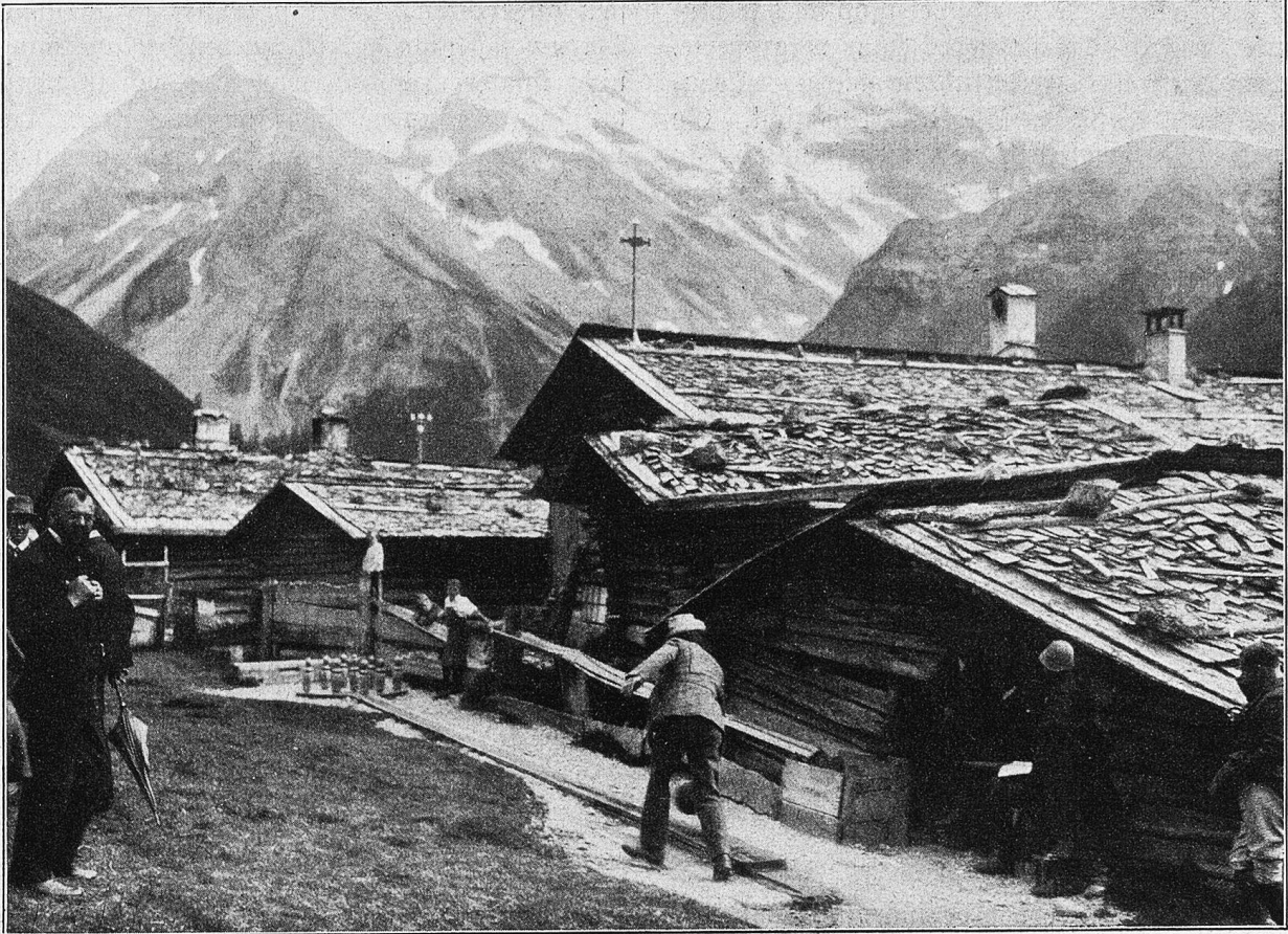
Beim sonntäglichen Kegelspiel.