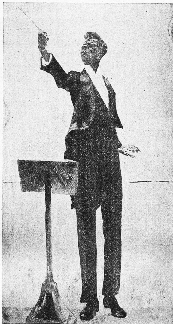
Der Dirigent. Von Cuno Amiet.

fern, seinen herrlichen Bäumen, aus denen er die Seele der Natur herausholt, hat niemand mit solcher Liebe gemalt wie er. Welch zitterndes Licht in seinen Innenräumen, welche Bewegung in seinen flatternden Vorhängen. Daß er ein Malerpoet ist, offenbaren seine in gedämpften Farben gehaltenen allegorischen Bilder, die wir unsern Lesern später einmal vor-