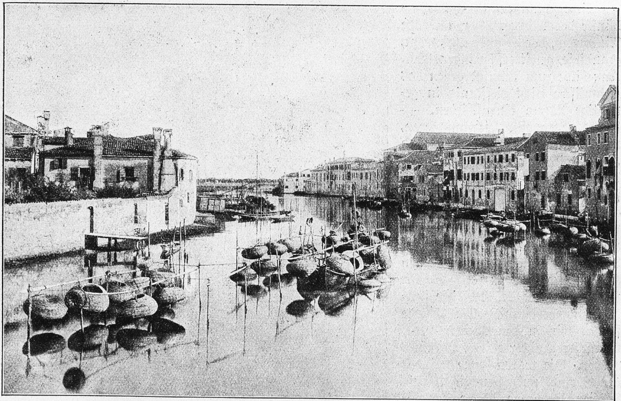
Das Fischer-Quartier in Venedig.

Die Begeisterung zu Lichterscheinung und Farbe war den Venetianern so im Blute, daß schon aus diesem Grunde ihre aufmerksame Pflege mehr der Malerei als der Skulptur zugeneigt war. Diese Stadt steht unter dem Himmel wie unter einer eng sie umschließenden Kristallglocke. Ihre Paläste bedürfen nur der Kanalseite zu einer schönen Fassade, diese ist dicht an das Wasser gerückt, denn es ist kein Platz da zum Verschwinden, hintenherum ist nur Raum für eine schmale Gasse. Auf Inseln zusammengestückt, zu notwendiger praktischer Ausnützung vorhandenen Raumes gedrängt, war der freien Entfaltung plastischen Denkens und plastischer Raumphantasie eine unüber-