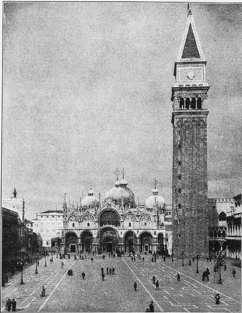
Der Markusplatz mit dem Campanile in Benedig.

aufs konservativste und ablehnendste stellenden Damen, fühlen hier die Pflicht schön zu sein, weshalb wir manchen in der Merceria rasch gekauften „venetianisch“ sein sollenden Seidenschawl nicht nur um hübsche Köpfe aus allen Herrenländern, sondern auch um die wahrhaftigsten Schultern der Spießbürgerin aus A. und V. malerisch geschlungen sehen. — Und zu all dem Kostümtreiben schallt von Nachmittags bis Mitternacht Musik aus allen Himmelsrichtungen. Kleine Orchesterchen sind in reizende nach vorne offene Kokoschmuckräume altberühmter Kaffeehäuser gesteckt, die ihre Tische und Stühle unter den Colonnaden hervor bis weit in die Piazza hinausstellen. — Besonders feierlich ist's aber, wenn nachts ein großes Orchester, auf ein hurtig aufgeschlagenes Podium hingezaubert, von der Mitte dieses Riesensaales aus, der den Sternenhimmel zur Decke hat, seine Trompeten- und Fanfaren-