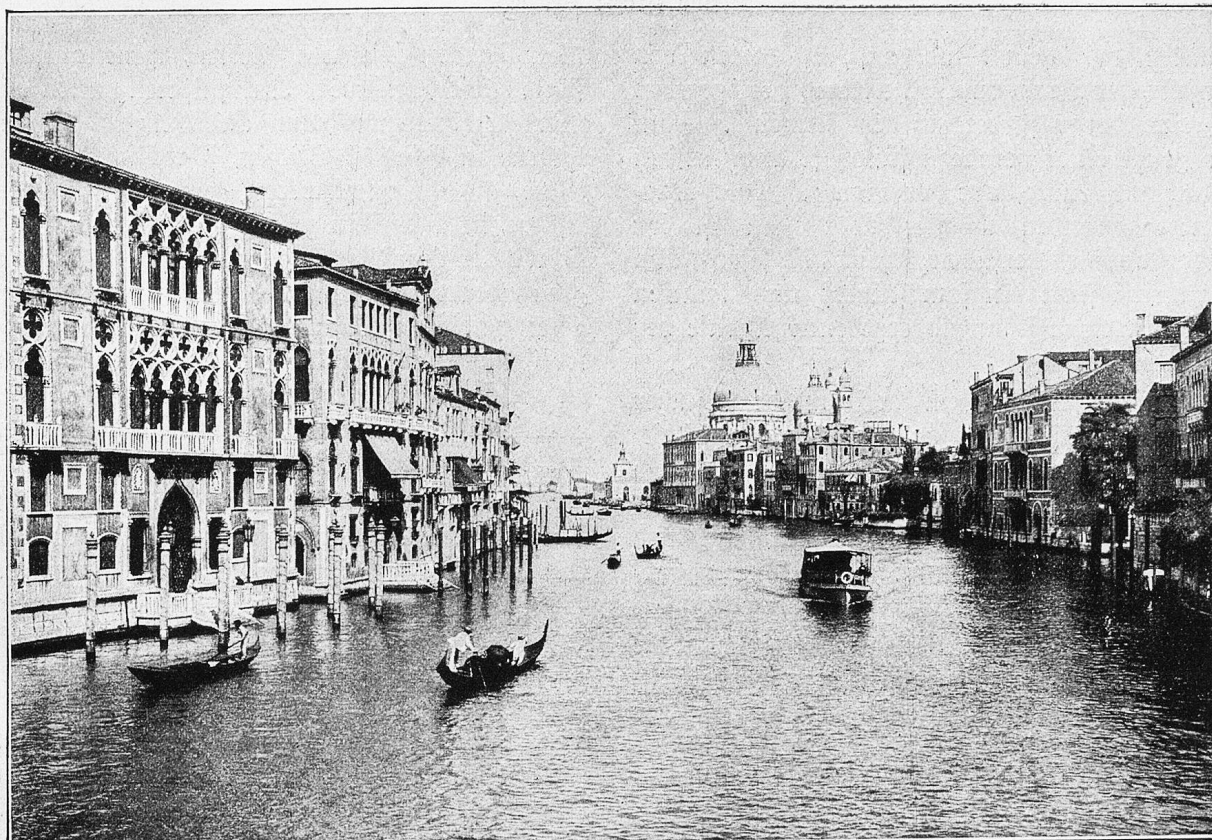
Der Canale grande in Venedig.