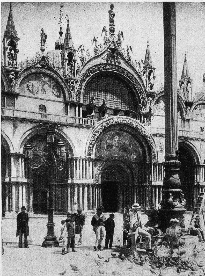
Sanct Markus-Kirche in Venedig.

illusion. — Und in den Schatzkammern Venedigs häuften sich die Golddukaten, man fühlte sich durch das umgebende Meer und eine gewaltige Flotte geschützt vor Feindeseinbruch. Der Stolz der Republik drängte nach Sichtbarmachung dieses Reichtums, man besann sich inmitten schwelgerischen Lebensgenusses auf seine Heiligen und auf alten Familienadel: Kirche an Kirche, Palast an Palast wurden erbaut. Alle Schichten der Bevölkerung beherrschte ein übereinstimmender Wille zu unerhörter Prachtentfaltung. Und in ihrem Streben geradezu aufgehetzt gegeneinander, drängten sich die Künstler hinzu, die leeren Wände der neu erstehenden Bauwerke gegen geringe Entschädigung, oft sogar ohne Entgelt, mit dem Raufsch ihrer Farben schmücken zu dürfen. Dazu kam die Eitelkeit der Bevölkerung einzelner Stadt-