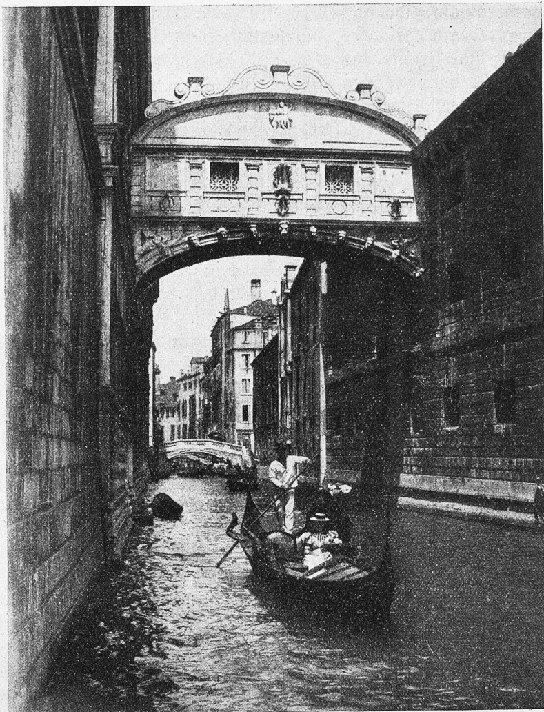
Seufzerbrücke in Venedig.

umsteht die Menge diese lächelnde Kokofogestalt. — Vor Denkmalsausrüstung des Markusplatzes, dieser größten freien Fläche, welche sich Venedig gestattete, hat glücklicherweise jedes Zeitalter ehrfürchtig Halt gemacht; er wollte nicht verstellt werden und der freien Entfaltung der Volksmasse und ihren Festen erhalten bleiben. — Das Monument des Re Vittorio Emanuele hingegen scheint als Vogelscheuche im Verein mit den vielen häßlichen Dampfschiffstegen einzig der Aufgabe zu dienen, die herrliche Riva dei Schiavoni zu verunstalten und das moderne Zeitalter gegenüber alter Kunst und Kultur lächerlich zu machen. Den dafür verantwortlichen Platzverwaltern und Verkehrstechnikern die Seufzerbrücke und Ferien in den Bleikammern!