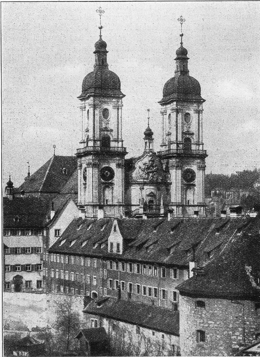
Stiftskirche von St. Gallen. Ansicht von Osten.