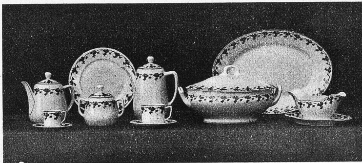
Tafel-Kaffee- und Teegeschirr.

Langenthal zeichnet sich besonders durch die stetigen, dem neuzeitlichen, künstlerischen Geschmack angepaßten Schöpfungen aus. Vor allem wird aber die echt schweizerische Eigenart gepflegt und dadurch hat das Schweizer Porzellan einen weit verbreiteten Ruf und viele Anhänger gefunden.