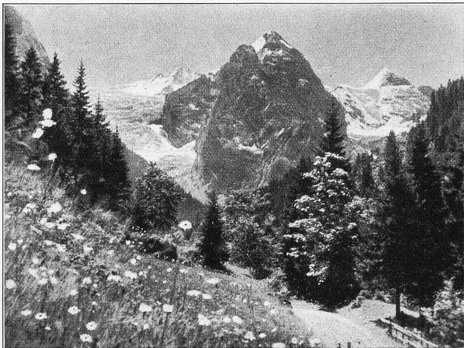
Wetterhorngruppe im Rosenlautal.

Dem guten Sepp lag das immer schweigamer werdende und bekümmerte Wesen seines früher so heitern Kindes schon lange schwer auf dem Herzen; gleichwohl hütete er sich, Klagen hervorzulocken, die nicht aus freien Stücken vor ihn gebracht wurden. Er war sogar froh, daß Anneli seinen Kummer für sich trug. Ehestand — Wehestand, dachte er und wußte dabei recht gut, daß, wo zwei durch diesen Stand verbundene