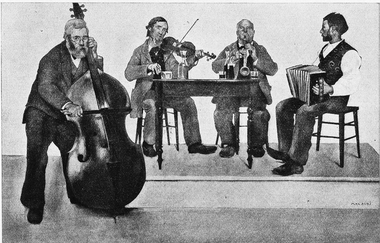
Max Buri: Die Tanzmusikanten.

Vielleicht gelingt's aber doch, die auffallende Tatsache einigermaßen begreiflich zu machen. Ich habe oben eigentlich nur die handwerksmäßige Seite der Sache besprochen und die inneren Vorgänge beim literarischen Schaffen zu wenig oder gar nicht ans Licht gehoben. Ich habe nicht gesagt, daß beim Dichten das Schreiben lediglich der Hand überlassen wird, ohne alle Aufsicht. Das Auge schaut zwar scheinbar hin auf die entstehenden Wörter und Zeilen, sieht sie aber kaum. In Wirklichkeit ist dieses Auge ganz nach innen gewendet, wo die Ereignisse vorgehen. Da sind alle Sinne zusammengelaufen, schauen und hören zu, tun mit und gehen gleichsam in Gestalten über, die draußen auf dem Papier in der Eile angemerkt werden müssen, ehe sie sich