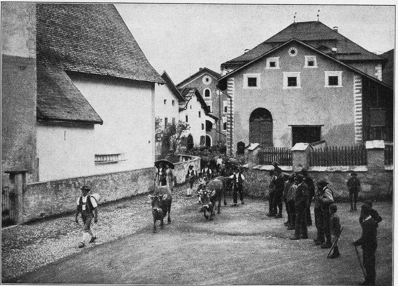
Alpfahrt bei Guarda.

verschneiten Walde hausenden Wilden Mann, den König des Waldes, einzufangen. Meistens wurde er ohne Gewaltmaßnahmen einfach herbeigelockt. Man stellte einen Tisch mit Wein ins Freie. Dann spielte die Blechmusik der ganzen Talschaft — verlockend, bezaubernd in gleichmäßigem Rhythmus. Sie lockte den Wilden Mann herbei, er kam scheu und zögernd immer näher, bis an den Tisch heran, trank ein Glas Wein, warf das leere Glas in den Bach und sprang in den Wald zurück. Man schoß ihm nach, er blieb mit einer Fußwunde liegen. Die Braut, weiß gekleidet, mit einem weißen Kranz im Haar, die beim Stamme wartete, verband ihm die Wunde. Der Wilde Mann wurde nun gefesselt und mit Ketten am Fuß des Stammes angebunden. Sein Kleid bestand vom Kopf bis zu den Füßen aus Tannenzapfen, Baumflechten und Zweigen. Der Stamm wurde sodann auf einen Bockschlitten gebunden. Das Volk stellte sich hinter diesem auf. Nun begann das Blockziehen. Achtundzwanzig kräftige Jünglinge zogen an Stricken den Schlitten. Der Wilde Mann wurde nachgeschleift. Vorn saß ein Fuhr-