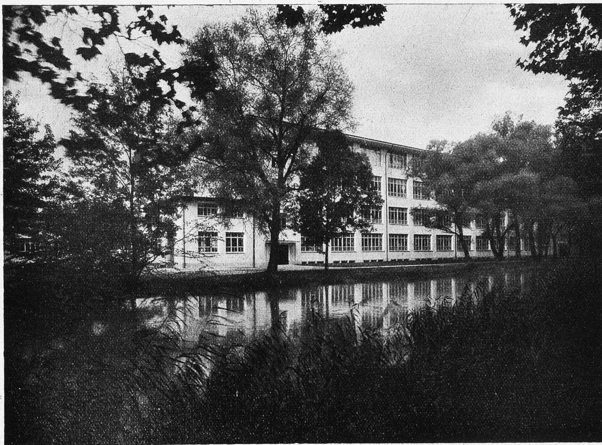
Stanzerei im Park in Schönenwerd.

einer schon um die Mitte des vergangenen Jahrhunderts blühenden Bandfabrik hervorgegangen ist. In diesem Gebäude sind heute 150 Webstühle im Betrieb. Der Bahnlinie entlang zieht sich auf eine lange Strecke der Park, der so recht eigentlich das Wahrzeichen von Schönenwerd geworden ist. Das große Gebäude der Stanzerie, in dessen weiträumigen Sälen die Schuh-