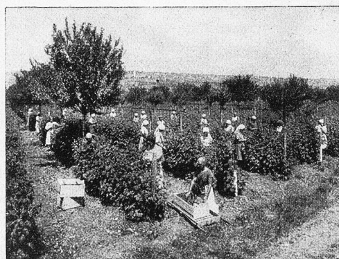
Himbeerpflücker in Hallau.

sind, wie sich dies von selbst aus den Mengen der zur Verarbeitung kommenden Rohmaterialien ergibt.