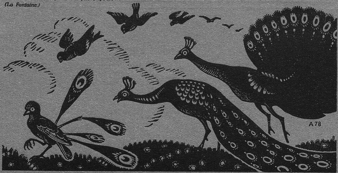
Der Häher mit den Pfauenfedern. (La Fontaine.)