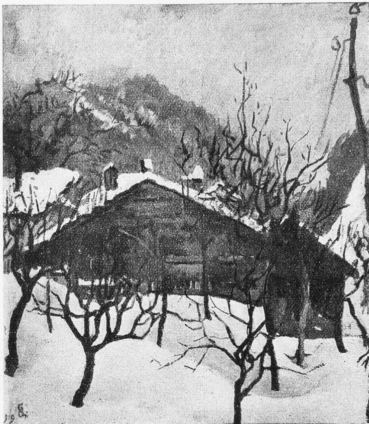
Giovanni Giacometti: Winterlandschaft.

„Sie haben ja eben selbst gesagt, daß es mein Fach nicht sei,“ meinte der Kaplan, ruhig lächelnd. „Einige Beispiele habe ich aber immerhin für meine Behauptung. Es wäre schlimm, wenn jeder Jugendeindruck unauslösch-