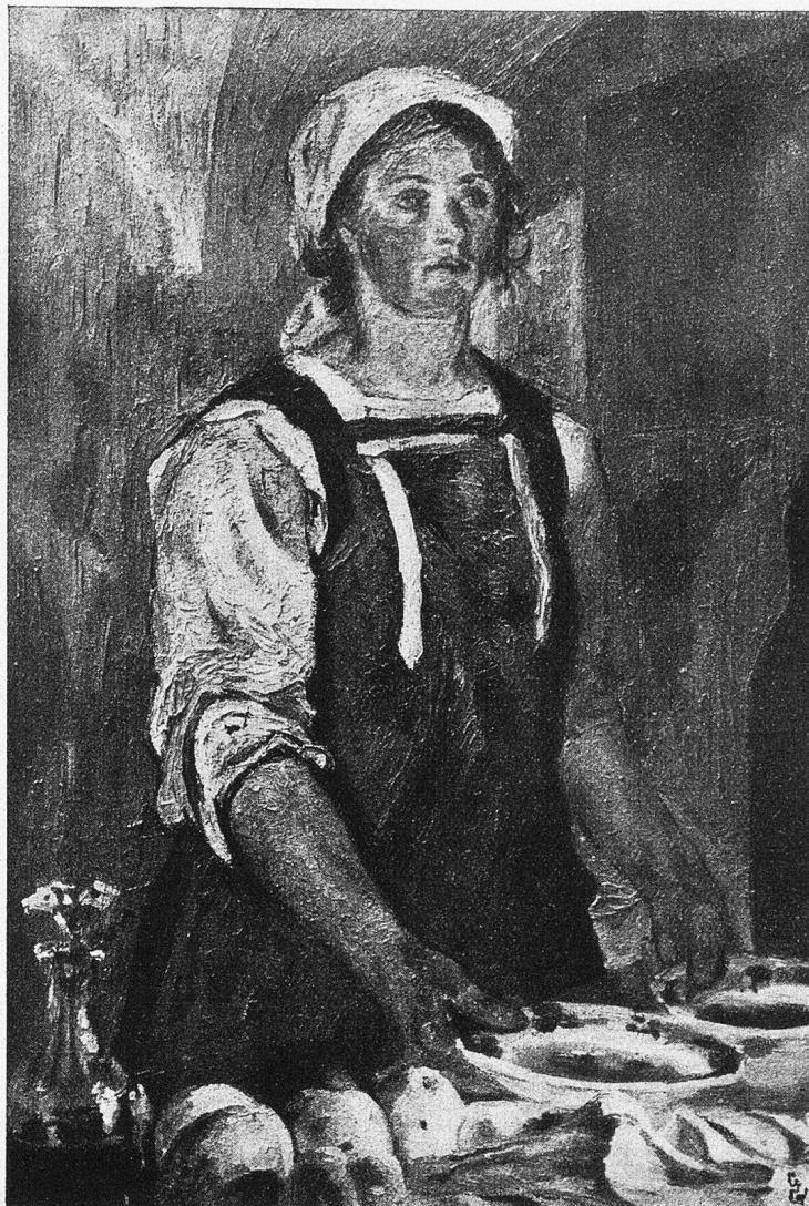
Giovanni Giacometti: Die Magd.

Dahnow las ergeben auch dies dritte Schrei-