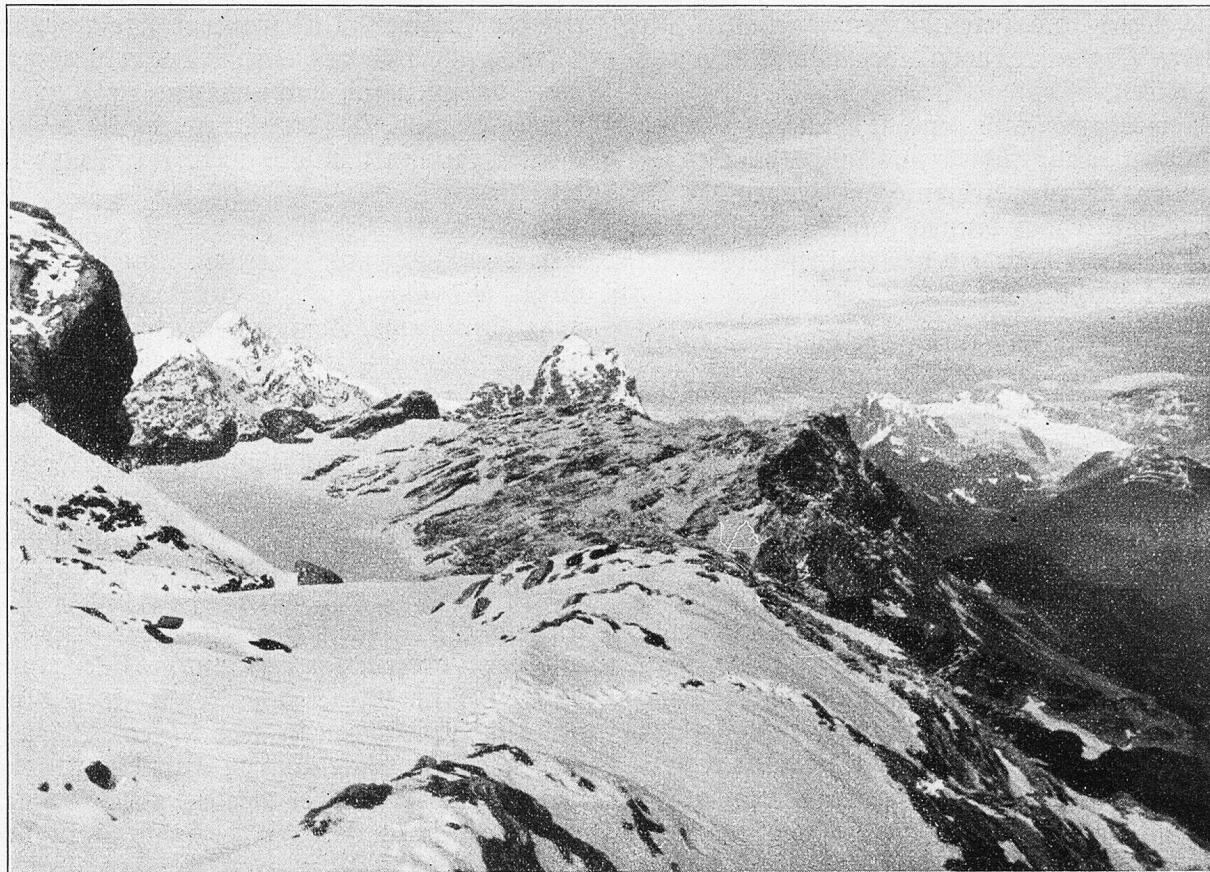
Ausblick vom Wege zur Clariden-Eiswand.