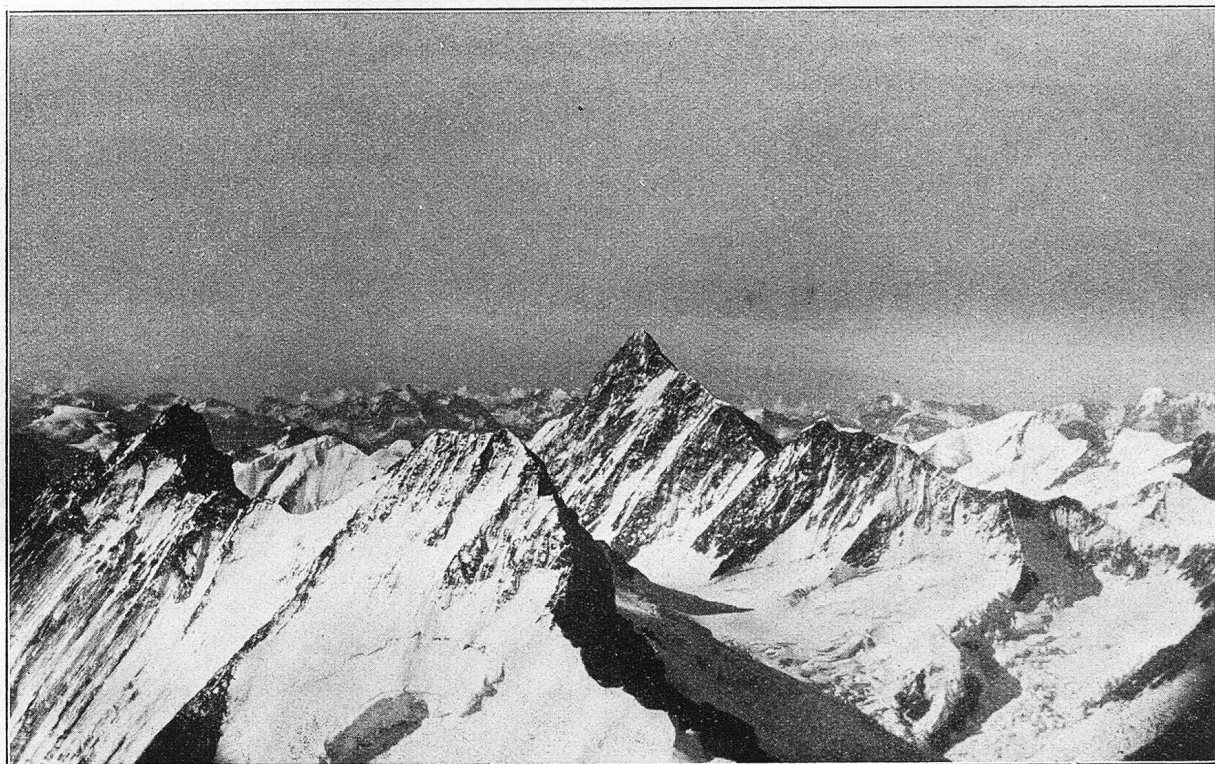
Lauteraarhorn, Schreckhorn, Finsteraarhorn.

3000, 3500 und 3800 Meter hinauf. Wenn die Schiebefenster zum Photographieren geöffnet werden, frieren wir beträchtlich an die Finger. Sonst aber herrscht angenehme Wärme in der Kabine. Der heizbare Raum ist so eingerichtet, daß man nach links und rechts und nach vorn, am Kopf des Piloten vorbei, bequem und ohne den Sitz zu wechseln, Aussicht halten kann.