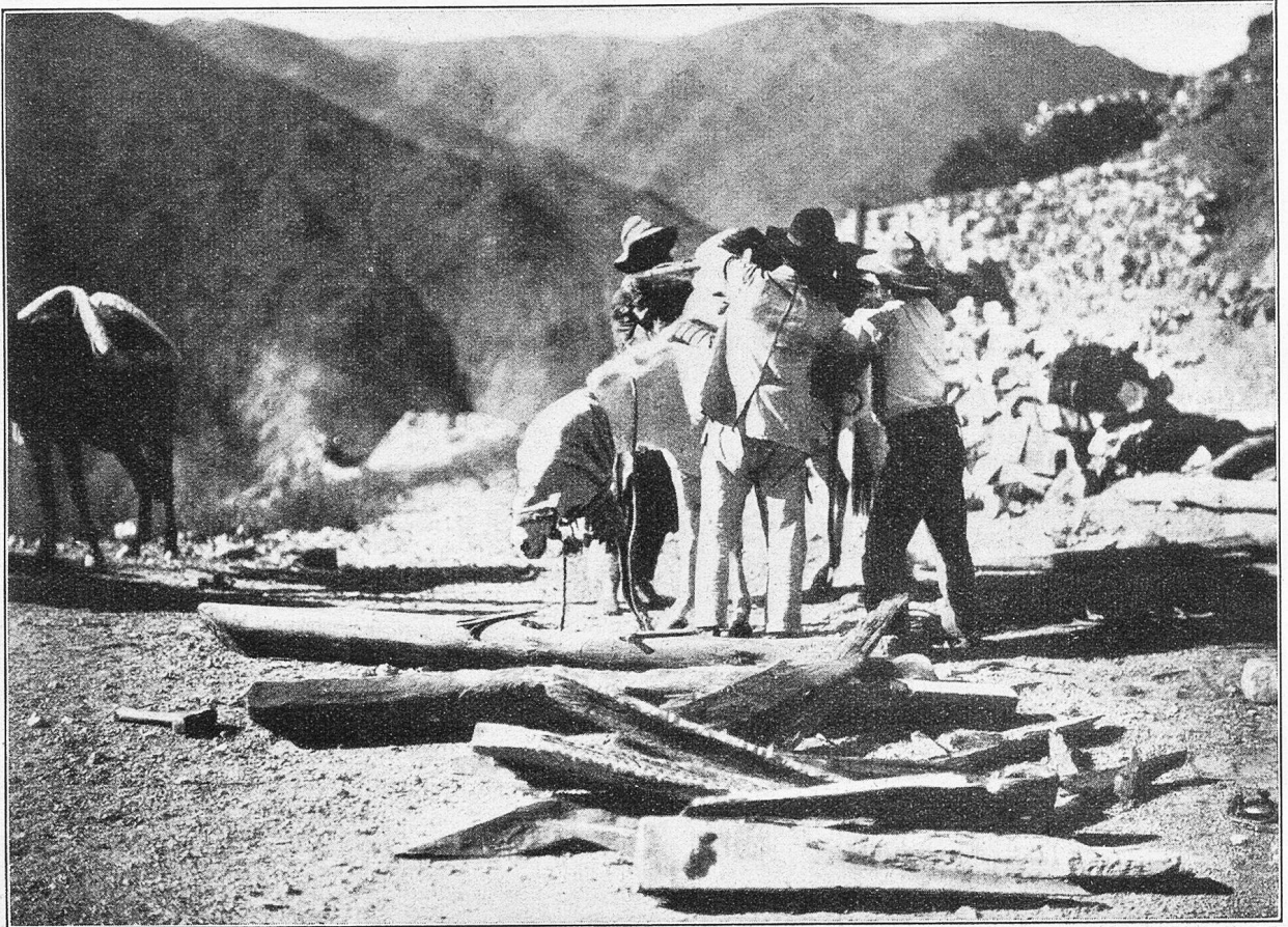
Beladen der Maultiere.

die in der Gegend von Andalgalá dauernd oder vorübergehend sich aufhalten. Im Laufe vieler Jahre hat er sie beobachtet und sein Material gesammelt, nach ihren Gewohnheiten geforscht und ihre Stimme in die menschliche Sprache zu übersetzen versucht. Über 180 Arten sind Herrn B. so bekannt geworden, manche von ihnen sind von hier an nur gegen den Süden zu bekannt, während wieder andere auf ihren Zügen von Bolivia her den Rand ihres Verbreitungsgebietes in dieser Gegend erreichen.