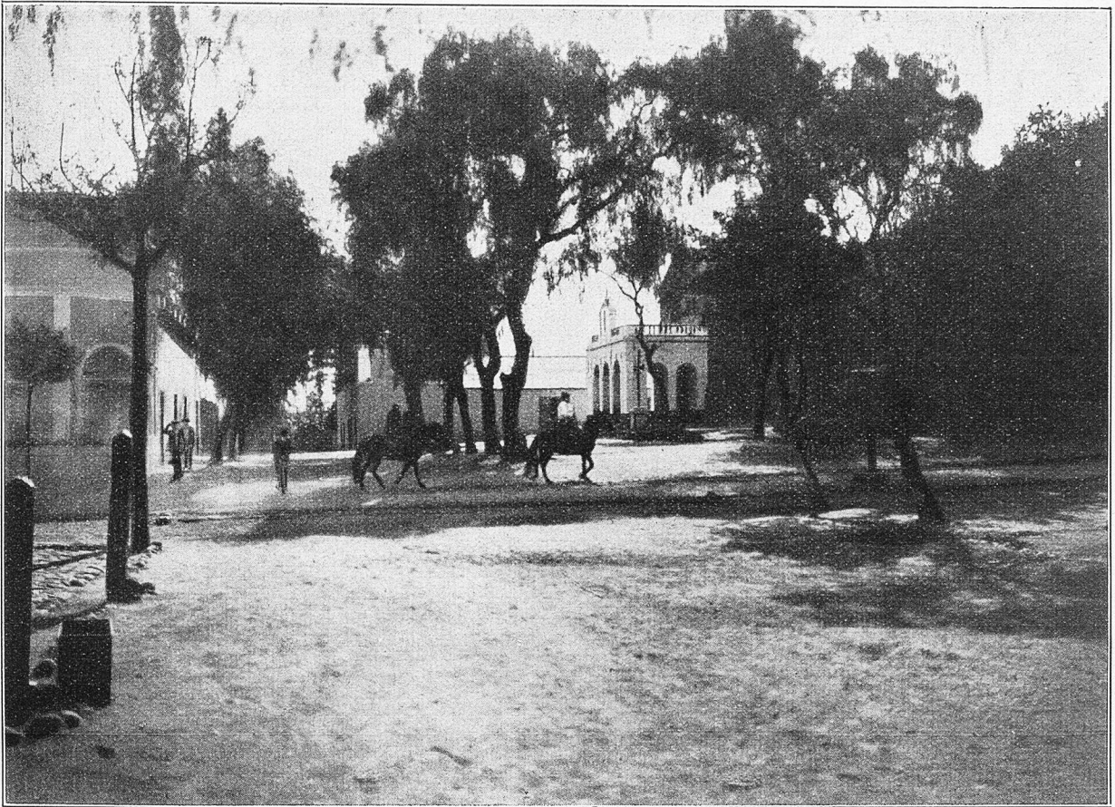
Dorfplatz und Kirche von Andalgalá.

lich von Andalgalá gelegen, brachten und Handel und Wohlstand der Ortschaft in höchster Blüte stunden.