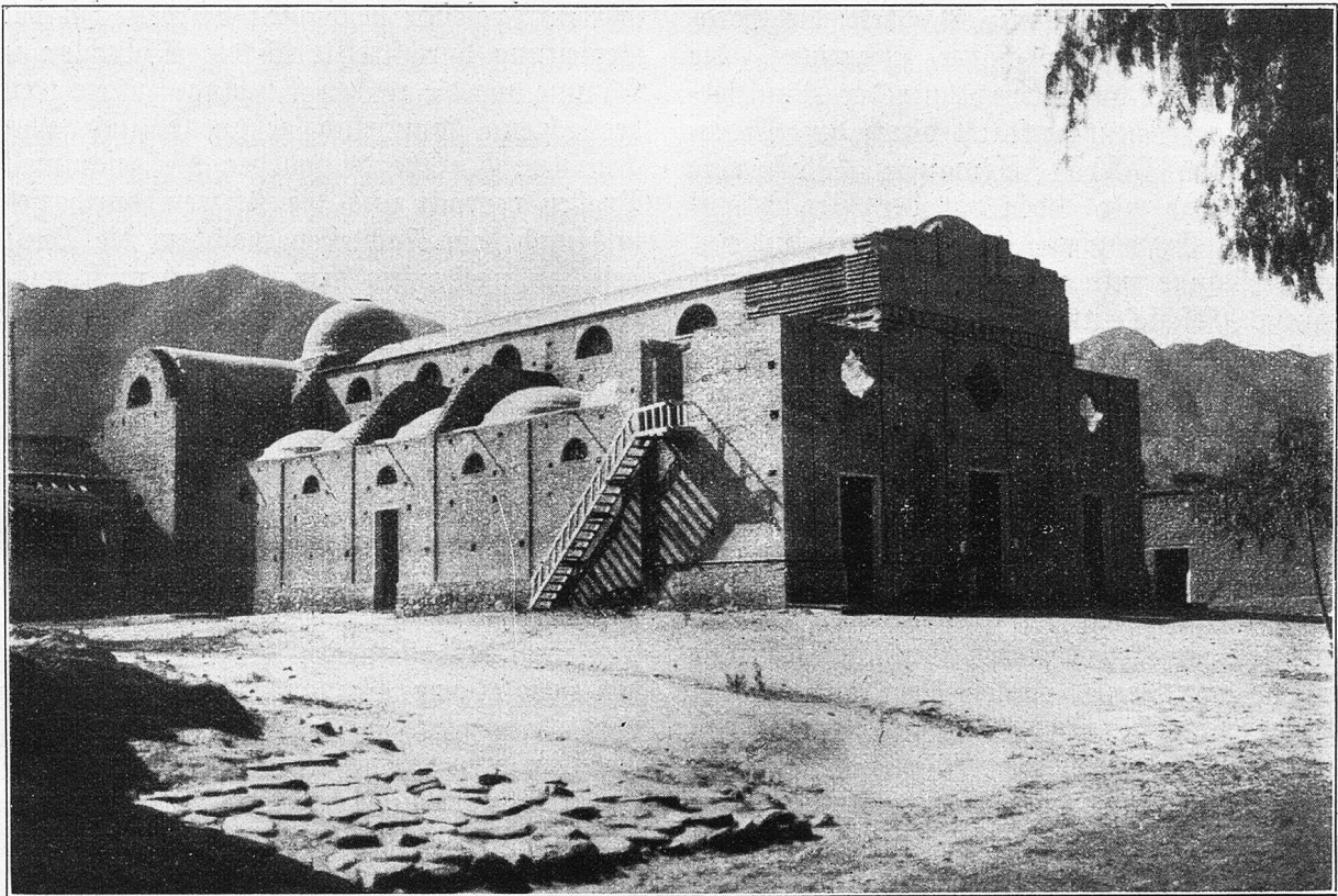
Kirche in Belén.

schätzen und Erinnerungen an längst vergangene Zeiten schon von früheren Besuchen her ans Herz gewachsen war.