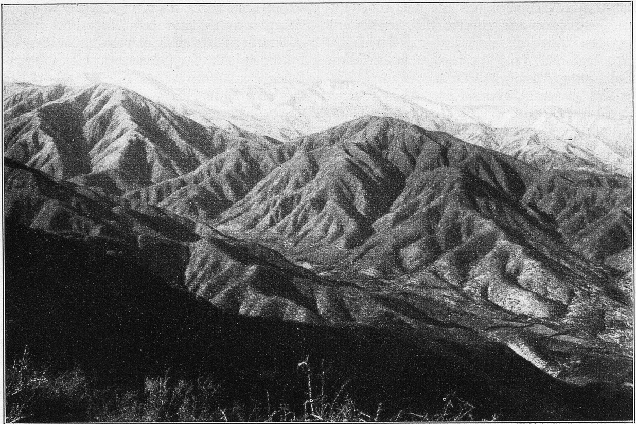
Aconquija von Südwesten. 5500 Meter ü. Meer.

lehrten Professor beschämen würden. In deren Begleitung durchstreifte ich die Schluchten und Kämme, wo die reichen Erzgänge zutage treten, beobachtend, sammelnd, zeichnend und photographierend. Abends wurden die gesammelten Proben verpackt und die Skizzen durchgesehen und nach dem Nachtessen, nachdem die Dunkelheit hereingebrochen war, setzte ich mich, wie ich es immer so gerne tat, mit den Leuten ums Feuer, wo noch ein Stündchen geplaudert wird und der Mate die Runde macht. Inzwischen wird am glimmenden Scheit eine Zigarette angezündet, die in einer Hülle aus Maischale den kurzgeschnittenen Tabak aus Tucuman enthält, oft vermengt mit einigen Körnern von Anis. An diesen abendlichen Plauderstündchen hat man Gelegenheit, recht manches zu hören, was sonst dem Reisenden verborgen bleibt. Für den neugierigen „Gringo“ ist es gar nicht immer einfach, das Gespräch dorthin zu lenken, worüber man gerne Aufschluß haben möchte, und erst im Laufe längeren Beisammenseins vernimmt man so allmählich von den Sagen, Sitten und Gebräuchen, die aus alten Zeiten her sich noch erhalten haben und mit der zunehmenden Anpassung an die heutige Welt