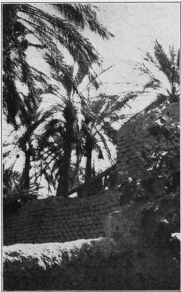
Biskra. Den Palmenpflanzungen entlang.

Noch andere Gewächse, Gemüse, Früchte, Sträucher gedeihen in der Oase. Die Palme aber schwingt obenaus. Sie ist die stolze Königin im Reich. Über alle schaut sie mit ihrem hohen Schirme, sie spendet Schatten und drückt der Landschaft ihr malerisches Gepräge auf. Und wenn's ein Palmenwald wird mit 150 000