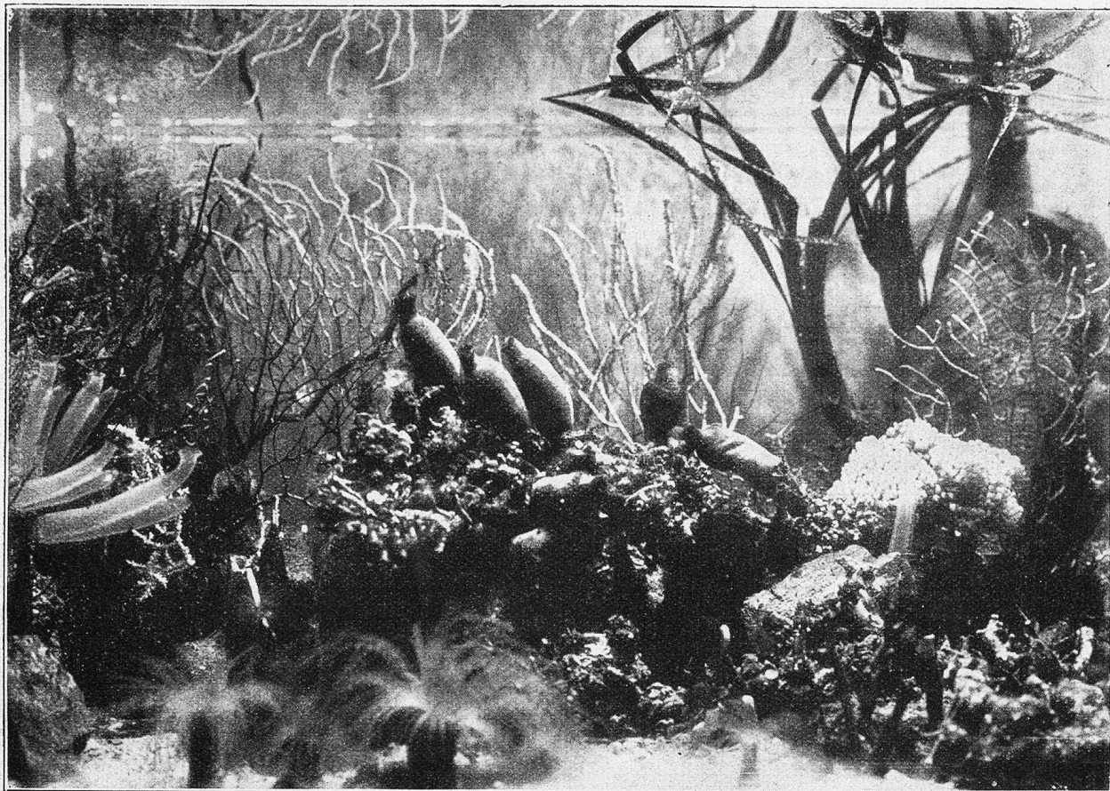
Ozeanographisches Museum, Monaco.