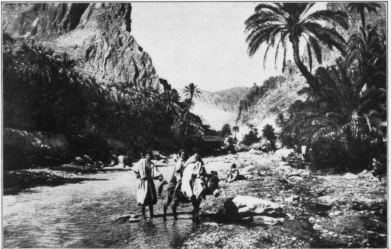
El Kantara. In der Schlucht.

Der Häuserkomplex ist im Stile ganz der Bauart der bescheidenen Araberhütten angepaßt. Wir werfen einen Blick in ein Schulzimmer zu ebener Erde. Halt! Da wird ja noch gearbeitet. Eine ganze Klasse. Flinke Burschen sind am Rechnen. Ein junger Lehrer geht durch die Reihen. Wir treten näher und dürfen einen Blick werfen in die originelle arabische Schule. Das Zimmer ist sauber und in guter Ordnung. Die Auskünfte, die uns gewährt werden, bringen ein paar verblüffende Tatsachen. Die Mädchen sind von der Schule befreit. Die Zurücksetzung der Frau beginnt hier sehr früh. Die Buben gehen fünf Jahre zur Schule. Die Ferien fallen in die heißeste Zeit, Juni, Juli und August. Der Morgen beginnt mit dem Frühstück in der Schule. Dann hebt der Unterricht an. Seltsam