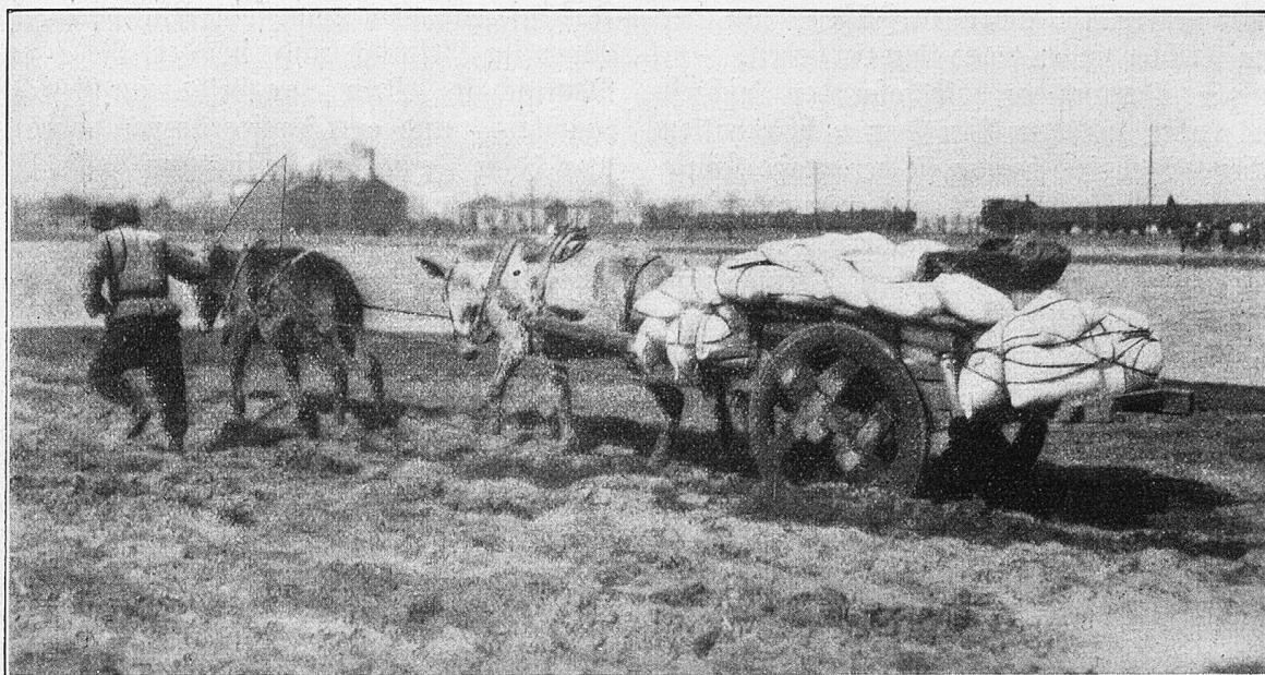
Auf der Karawanenstrasse nach Shan-hai-kuan. Salztransport.

Im Dunkel nahmen sie diejenige Stelle des Felsens in Angriff, die am steilsten und deshalb unbewacht war. Gleich anfangs drangen sie nur mühsam aufwärts, und bald begannen jäh abstürzende Felswände, glatte Eislagen, lose Schneedecken; mit jedem Schritte wuchs die Anstrengung, die Gefahr. Dreißig dieser Kühnen stürzten in den Abgrund, versanken im Schnee. Aber mit Tagesanbruch hatten die andern siegreich den Gipfel erklimmt und ließen ihre weißen Wimpel flattern.