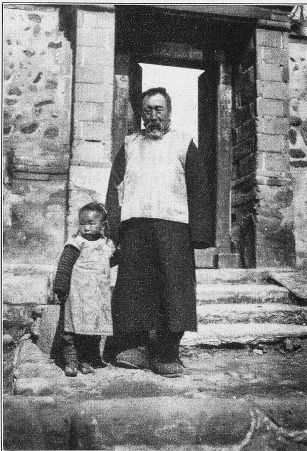
Typen von Chan-hai-kuan.

In ihrer Heimat aber, in den Gegenden jenes Felsenestes, in den Gebirgen Zentralasiens,