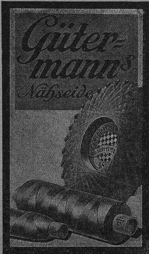
Gütermanns Nähseiden A.-G. Zürich Fabrikation in Buochs (Nidwalden)