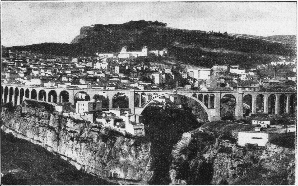
Constantine und die Brücke Sidi Rached.

Es lockte uns, eine Moschee zu betreten. Unser arabischer Führer, ein junger, kurzweiliger