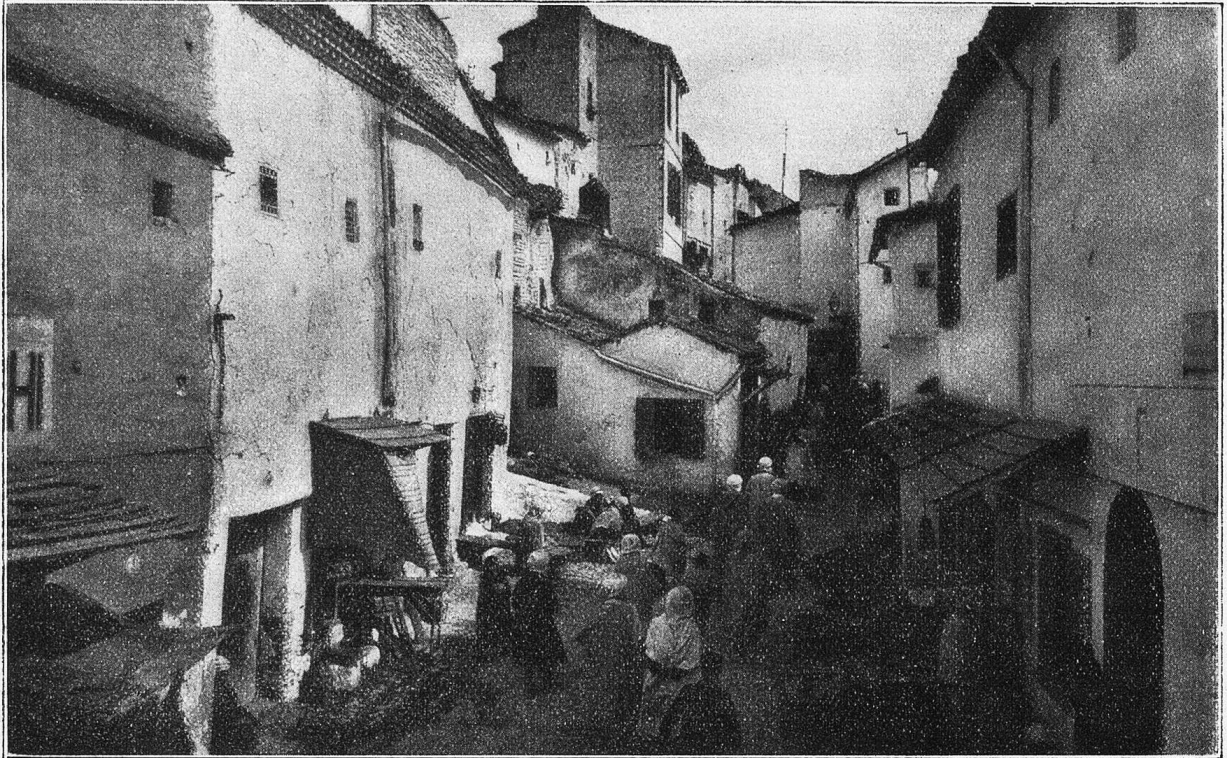
Constantine. Straße im Eingeborenenviertel.

sucher ist es bequem gemacht, die ganze Schlucht zu durchwandern. Der Chemin des Touristes führt ihn hinunter bis zur Sohle des Tales und zwei Kilometer weit an den schreckhaften Abflüssen vorbei, über denen die Stadt errichtet wurde. Und dort, wahrhaftig, klettert von höchster Höhe ein Pfad hinunter zu einer unwirklichen Behausung auf halber Höhe. Wie ein Habichtsnest klebt sie an der Wand, und eine Höhle führt in die Felsen hinein. Menschen wohnen dort wie vor zwei, vor dreitausend Jahren. Der Schlupf kennt weder Treppe noch Fenster. Stube, Küche und Schlafraum sind eins. Am Eingang gähnt der Abgrund.