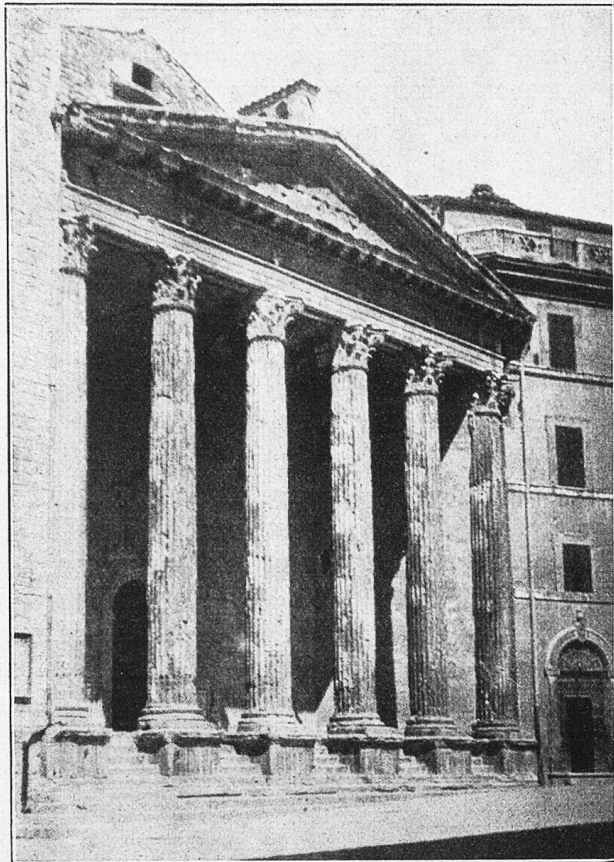
Assisi, Tempel der Minerva.

lich sah er hinter einer dichten Hecke den goldenen, vom König Melchior auf einer dünnen Stange getragenen Kometen glänzen. Franzl