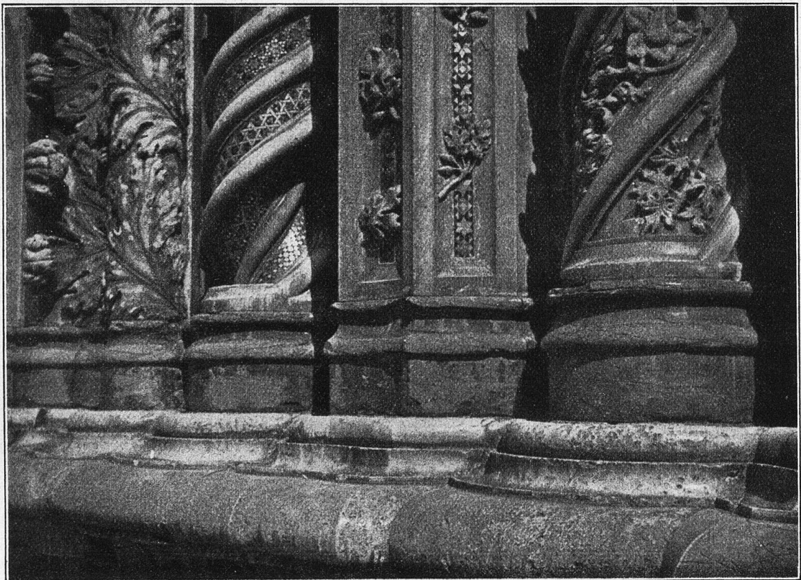
Dom zu Orvieto, Detail des Portales.

Nicht rühren können! Das ging ihm ins Herz, als hätte sich eine kalte Hand darum gelegt. Wenn jetzt der Schustermichel und die Schreinerbuben kämen, um sich über seinen Korb und seinen Zwerchsaß herzumachen — er