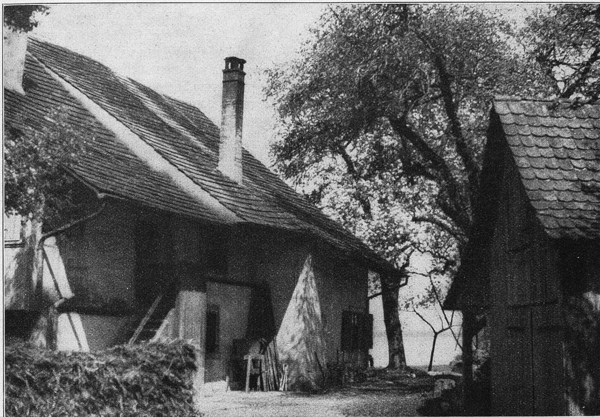
Fischer- und Bauernhaus in Ermatingen.