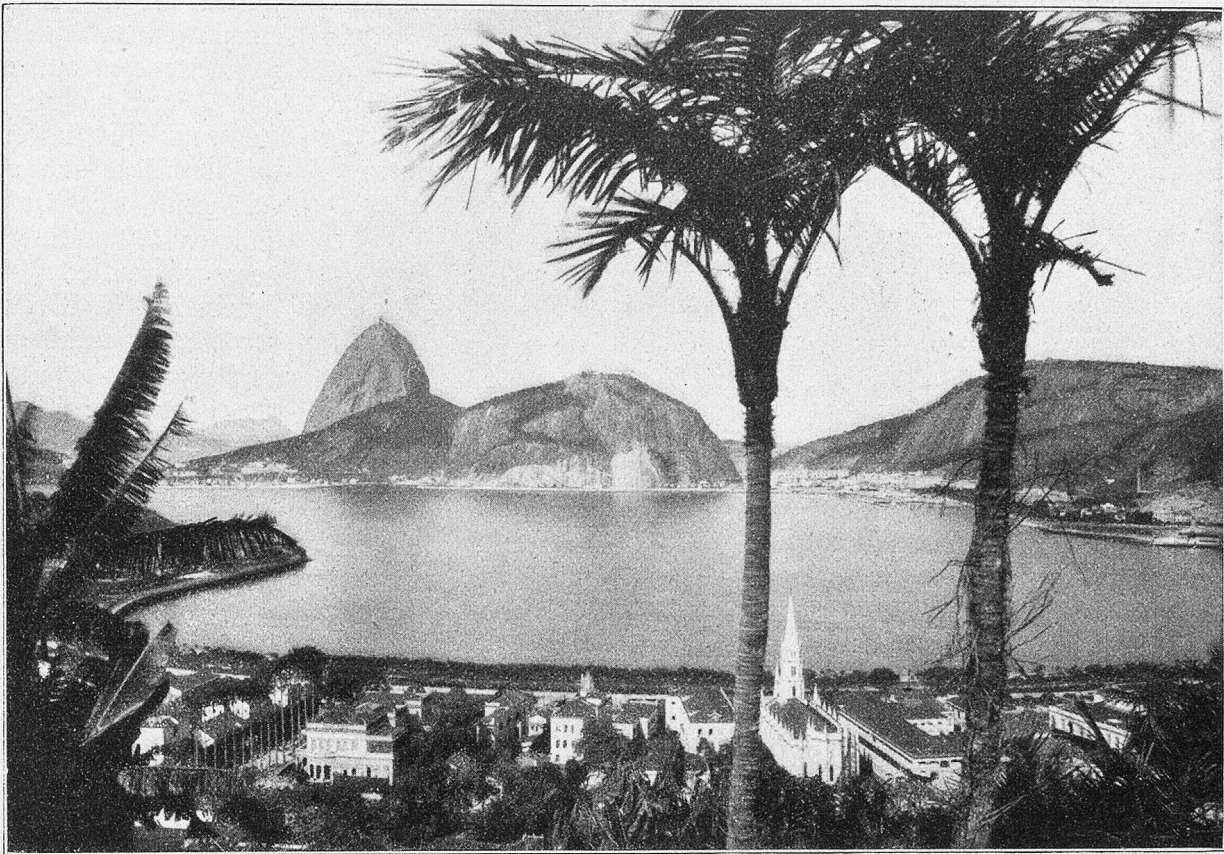
Rio de Janeiro mit Zuckerhut.

Sporenbewaffneten tapfern Hähne sprangen sich sofort an, schlugen mit den Flügeln und hackten aufeinander los, ohne daß ein Erlahmen des einen oder andern zu erkennen gewesen. Nach Ablauf einer Viertelstunde wurde eine Pause eingeschaltet, die Tiere mit kaltem Wasser benetzt, massiert und, frisch gestärkt, von neuem aufeinander losgelassen. Da wir weiter wollten, konnten wir uns nicht länger aufhalten. Unter lauten Kommentaren der „Impresarios“, deren jeder einzelne die Güte seines Tieres pries, verließen wir das unter freiem Himmel hier in Szene gesetzte eigenartige Schauspiel.