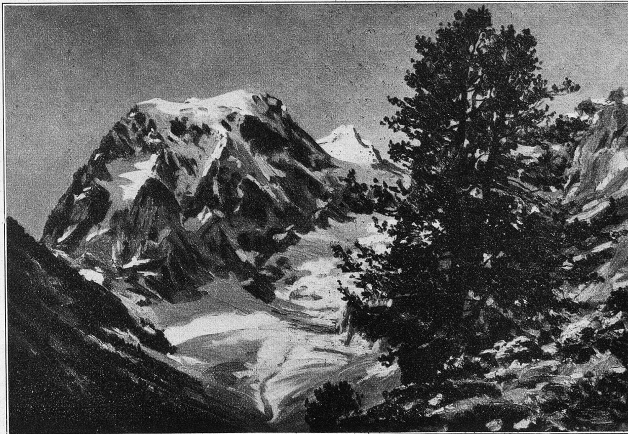
Mont Collon (Arolla).

Es stehen stattliche Häuser da, die vom Wohlstand der Evolener zeugen, Häuser, die so selbstbewußt dreinschauen wie die Evolener selbst, die nicht zu Fuß gehen, die alle ihre Neben haben im Rhonetal und „Glacier“ im Keller und hundertjährigen Käse. Es steckt Käse in dem Dorf und Käse in den Leuten; das Festhalten an der Tracht, die allgemein und nicht bloß Sonntagsstaat ist, zeugt allein schon von