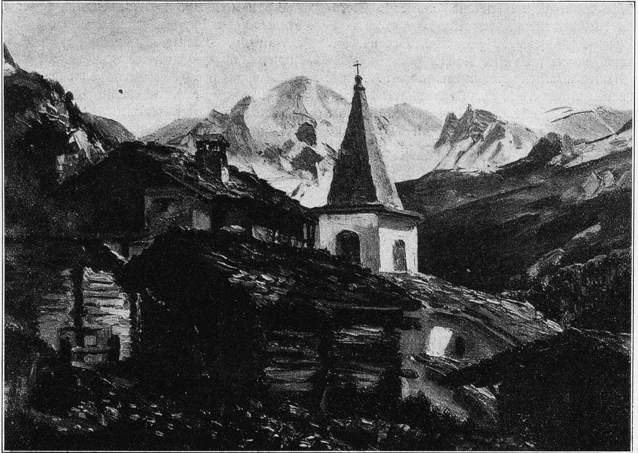
La Sage (Val d'Herens).

Nach einem Gemälde von E. Burthard, Rächterswil.