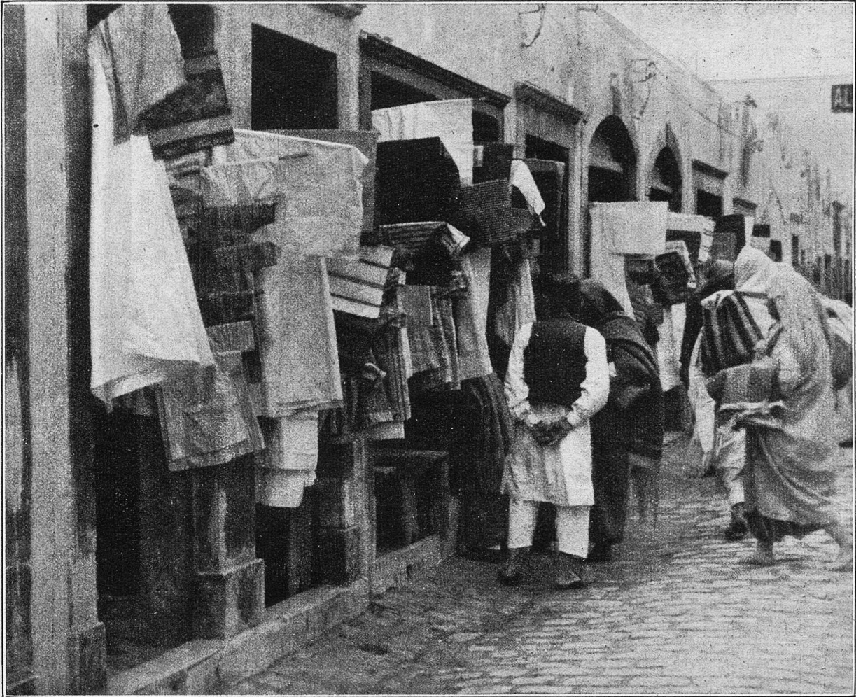
In den „Suks“, der Bazarstraße von Tripolis. Die Leinenhändler.

ten Lederriemen unter seinem Kinn zuschnallte. Sie verdeckte ihm schier die Augen.