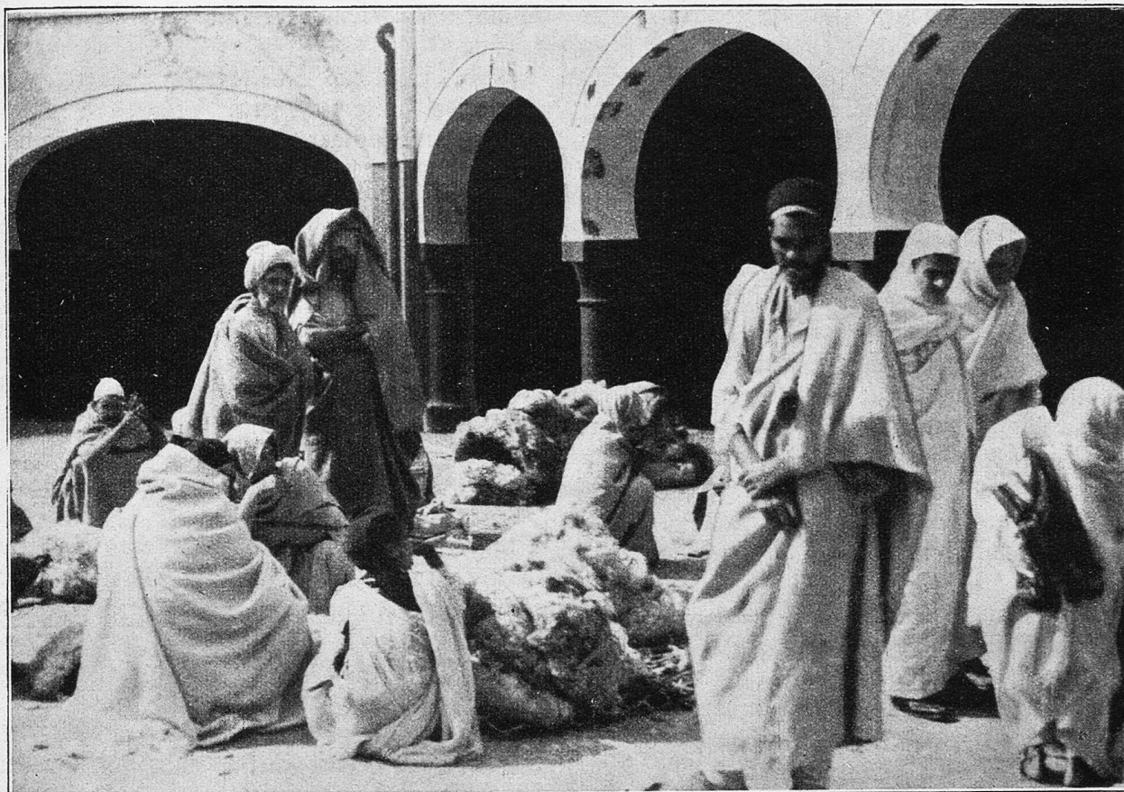
Auf dem Wollmarkt in Suif el Dschuma (Dase).

können im zweiundachtzigsten Jahre!“ — „Heja zum Donner, da habt Ihr doch Zeit genug gehabt, es zu lernen und zu üben!“ meinte der Bursche. Ein Aufklappen ging um den Tisch. „Freilich schon“, machte die Alte; „aber ich hab’s halt seither wieder verlernt!“ — „Das kann ich nicht glauben“, lachte er; „denn was die Weiber einmal gern und gar selbender gelernt haben, vergessen sie ihr Leben lang nicht mehr! Laß an, Wyfel!“