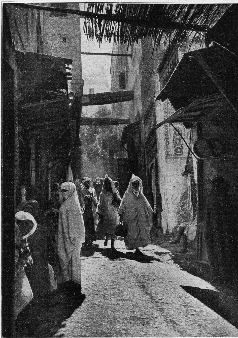
Jes. Rue du Talaa.

Rosen blühten in eingefachelten Beeten, breite Mosaiken bildeten den Mittelgang, vertieften sich zu flachem Becken, in welches plätschernd der Wasserstrahl niederfiel — Palmen