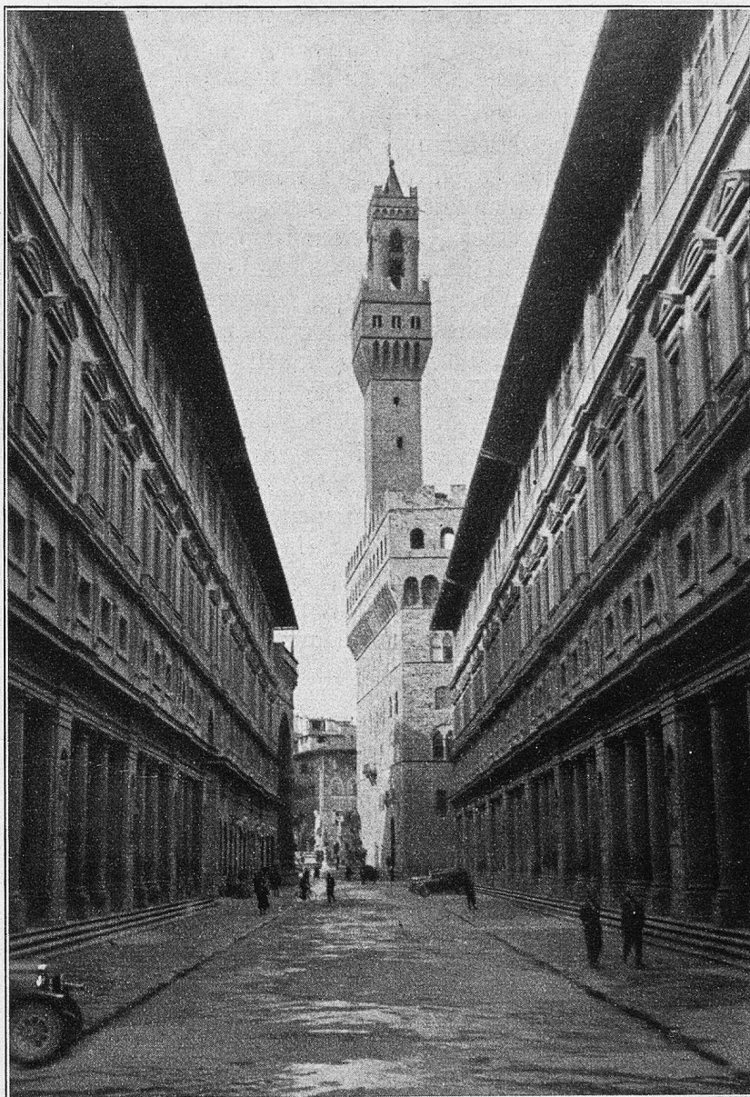
Florenz: Die weltberühmten Uffizi-Galerien.

Am Ende eines jeden Tagesmarsches wurde zuerst eine sichere Stellung gesucht und ausgebaut. War das geschehen, so schickte die Legion — genau so, wie es bei den Truppen üblich war, mit denen Julius Cäsar Gallien eroberte — einen Schleier von eingeborenen Hilfsvölkern vor, um mit dem Feinde Fühlung