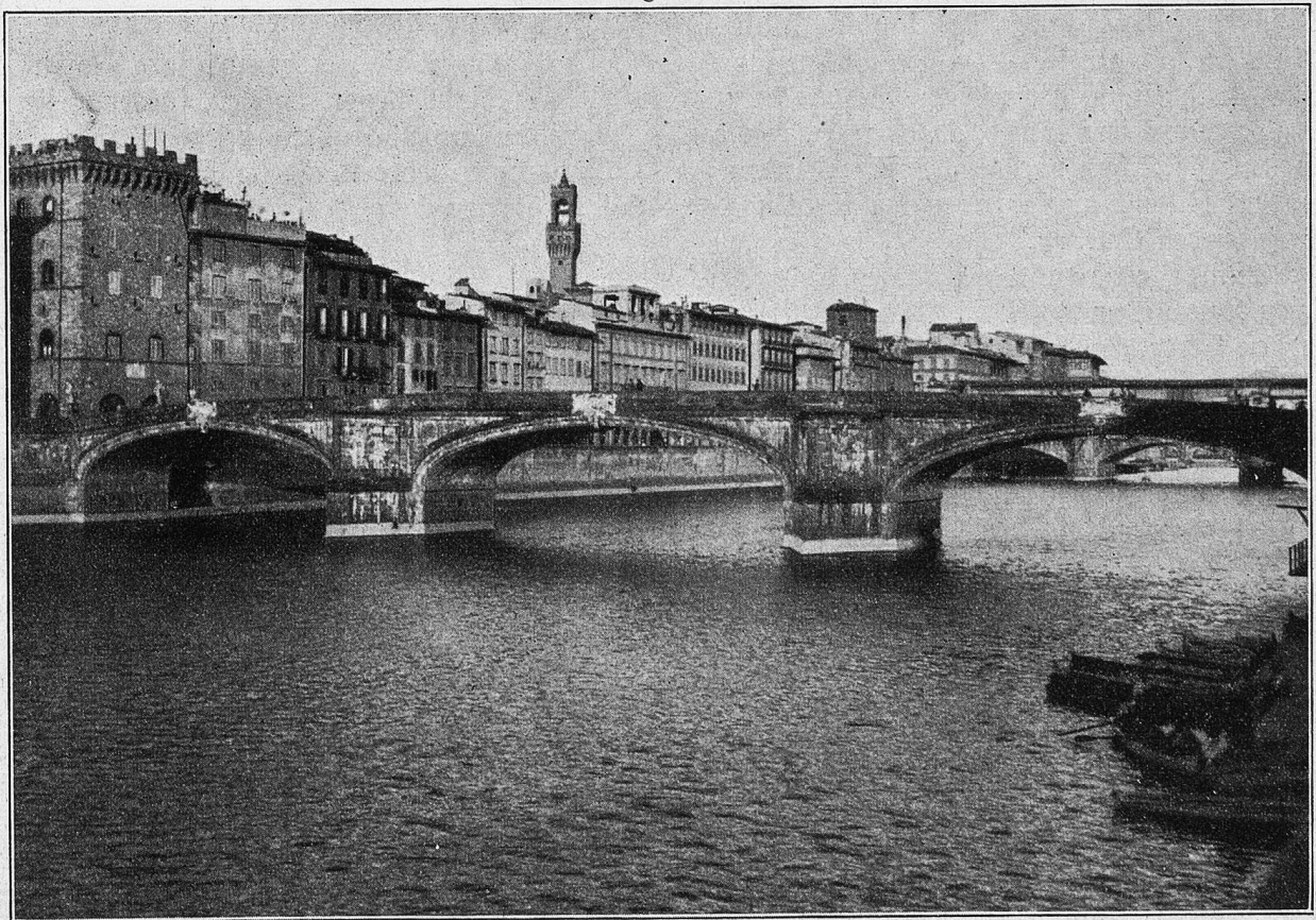
Florenz. Die elegante Trinita-Brücke.

Duskounti war schon mit seinen Leuten den Berg weit heruntergekommen, bevor er — beim schwachen Morgendämmern — entdeckt werden konnte. Die Fliehenden liefen in das große Amtrouk-Tal und stießen in einem Hohlwege mit einer Patrouille französischer Hilfsstreitkräfte zusammen. Somit war der Fluchtversuch mißglückt, und es blieb Duskounti und seinen Leuten nichts weiter übrig, als — unter der schwersten französischen Granatfeuer — den Weg zurück in die Berge zu nehmen.