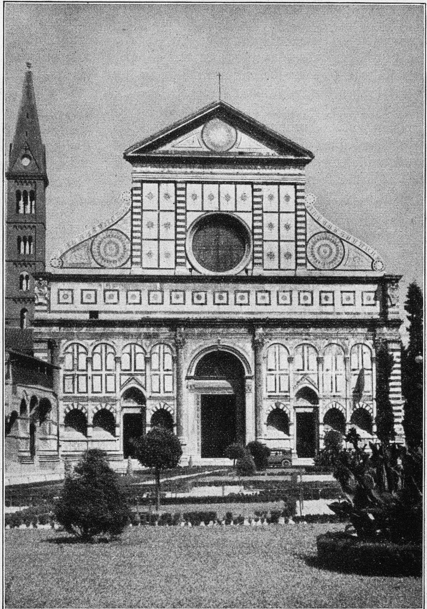
Florenz: Die Fassade von Santa Maria Novella.

Es war geradezu erstaunlich, welche Wandlung eine Nacht des Waschens, Schabens und Polierens bei den mit Schmutz verwachsenen französischen Truppen zustande gebracht hatte. Die Kompagnien der Fremdenlegion sahen so sauber und ordentlich aus, als wenn sie sich auf dem Kasernenhofe ihres Hauptquartiers in Sidi-Bel-Abbes befunden hätten. Die berühmte blaue Taillesschärpe, das wesentliche Merk-