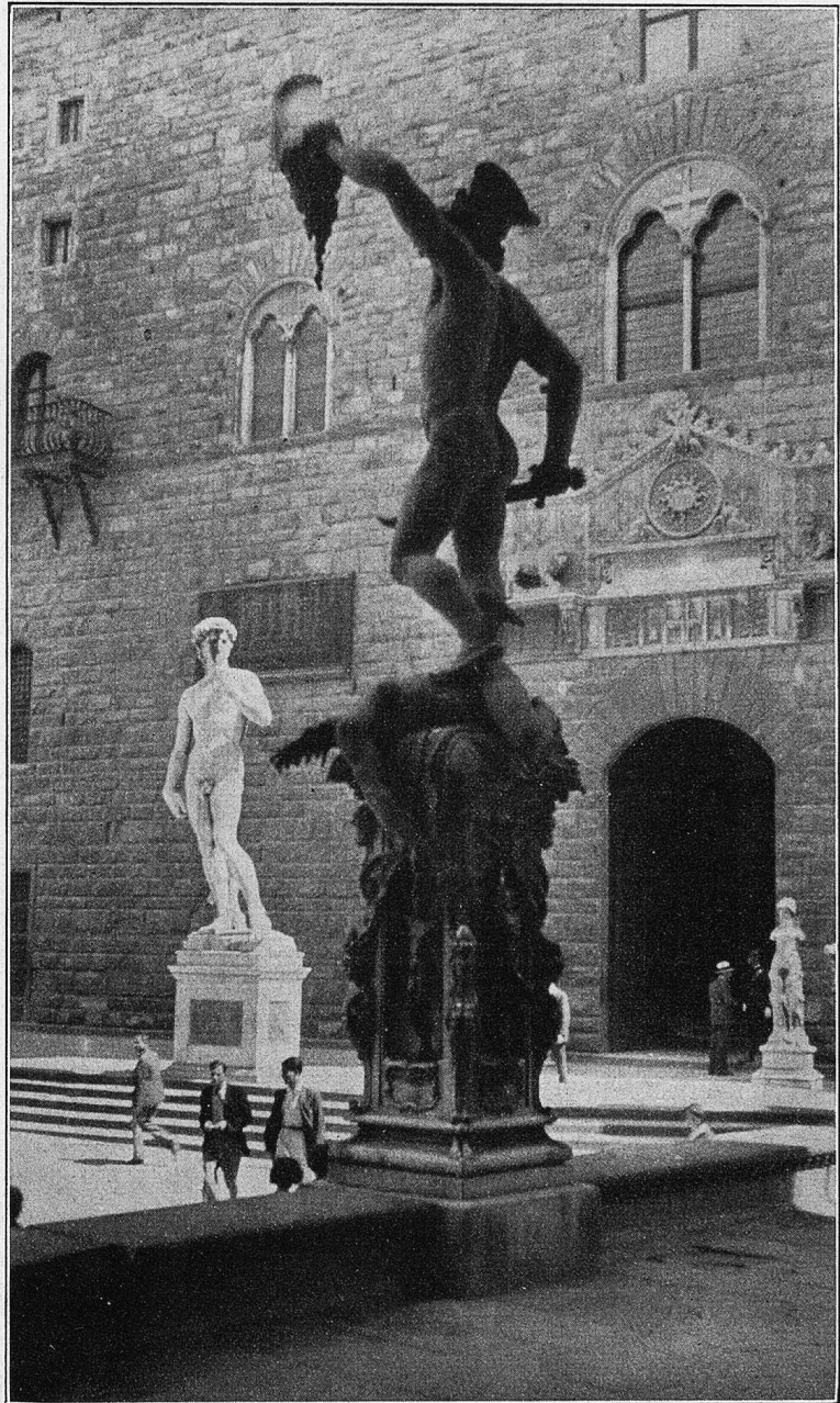
Florenz. „Perseus“ von Cellini in der Loggia dei Lanzi.

Beim morgendlichen Dämmerchein kamen die grimmigen Gebirgler, von Fels zu Fels huschend und nur eben wahrnehmbar in ihrer