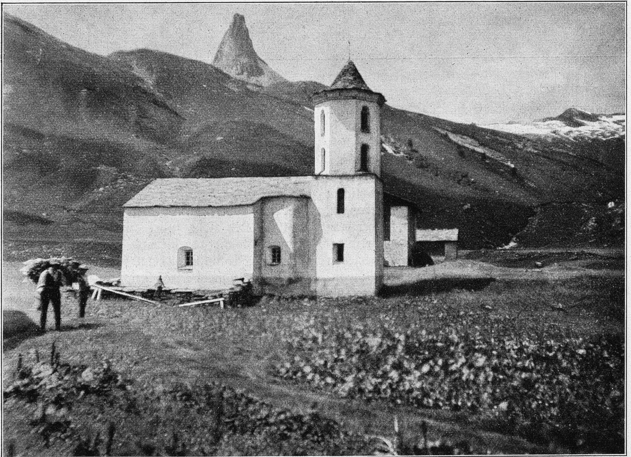
Kirche von Zerfreila (Wals), hinten Zerfreiler Horn.

Steigen wir aber talaufwärts über den im 16. und 17. Jahrhundert durch den Lastverkehr ziemlich reichlich benützten Paß, die Forcellina, zum Septimerpaß hinüber. Seit dem frühen