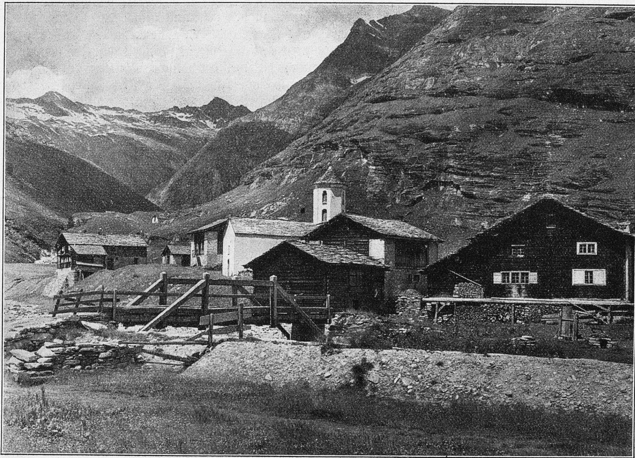
Berfreila im Val.