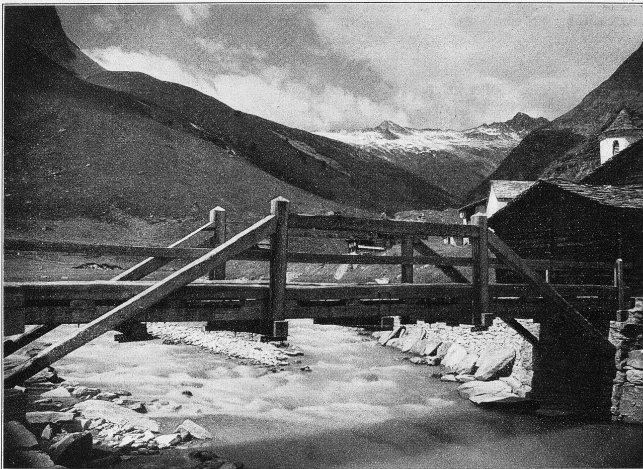
Brücke bei Zerfreila im Vals (1780 Meter ü. M.).