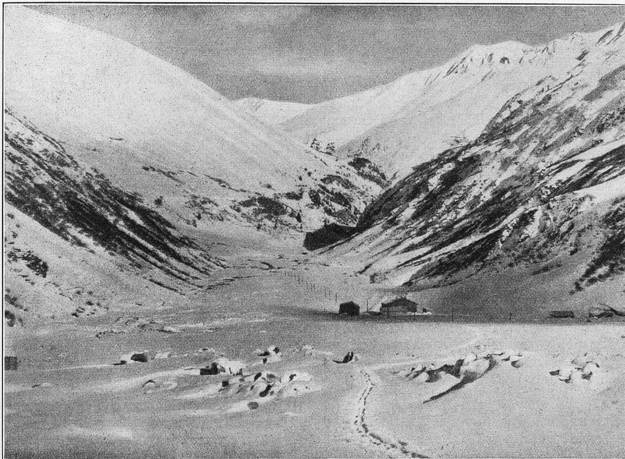
Durchs Entremont-Tal zum Großen St. Bernhard.

taumel der braven Tiere sofort Einhalt zu gebieten. Die prächtigen Kerle umringten ihren Herrn, wie wenn sie ihn um Verzeihung ob ihrer Ausgelassenheit bitten wollten.