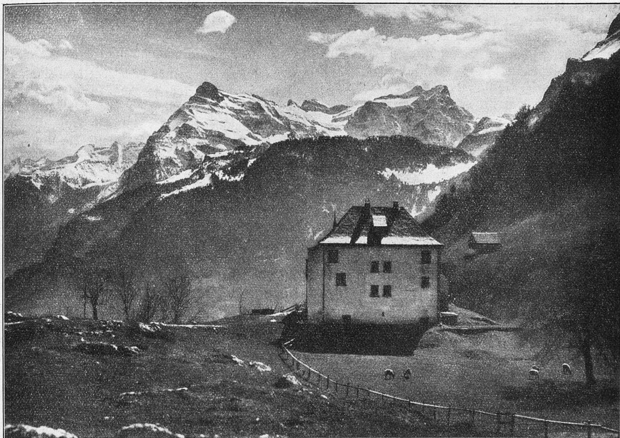
Ein kalter Frühlingstag.