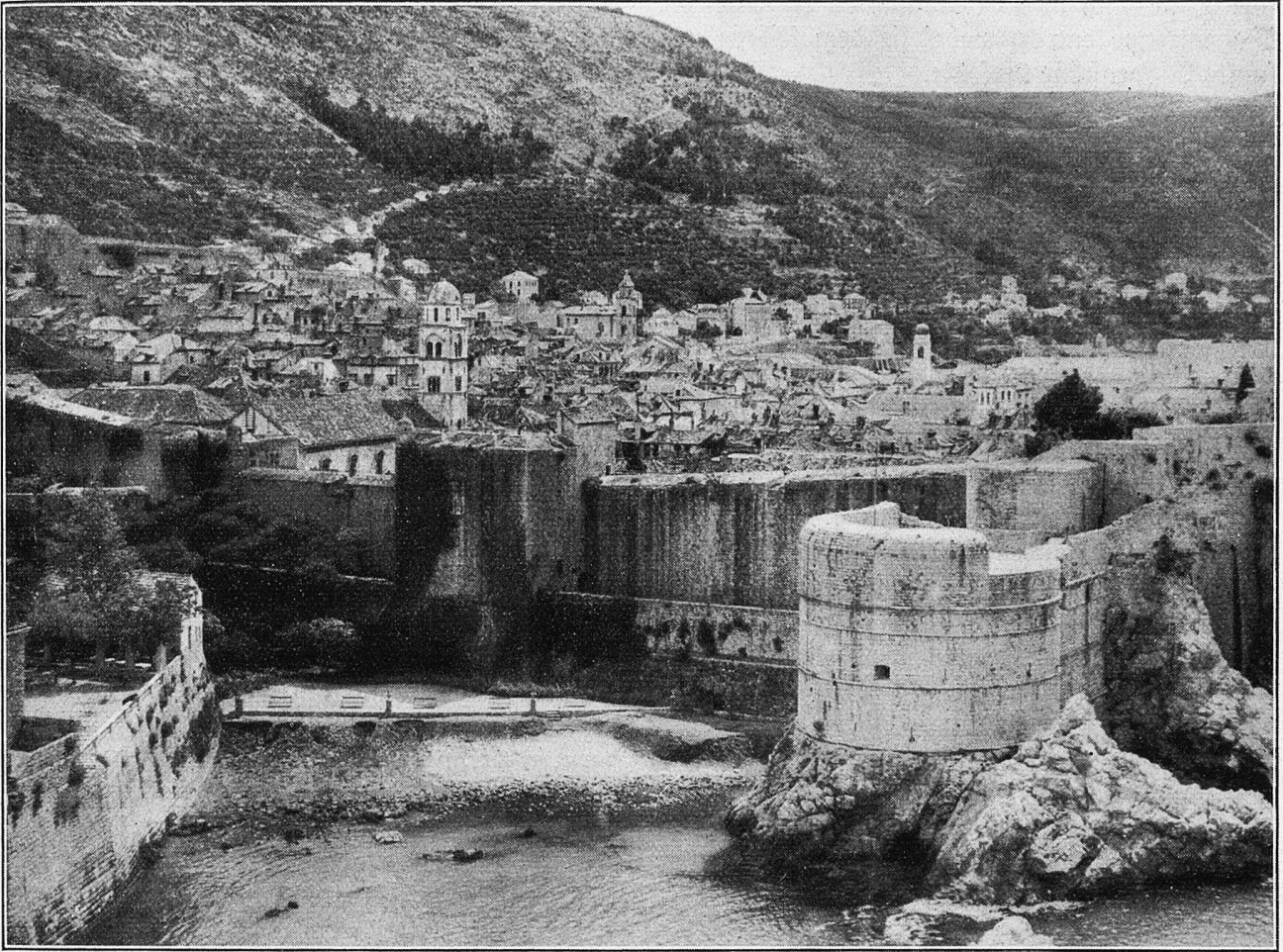
Ragusa. Auf Klippen hinausgebaut, auf Berghänge hinaufgeschoben, von wuchtigen Mauern umgürtet, träumt diese entzückende Stadt von ihrer romantischen Vergangenheit.