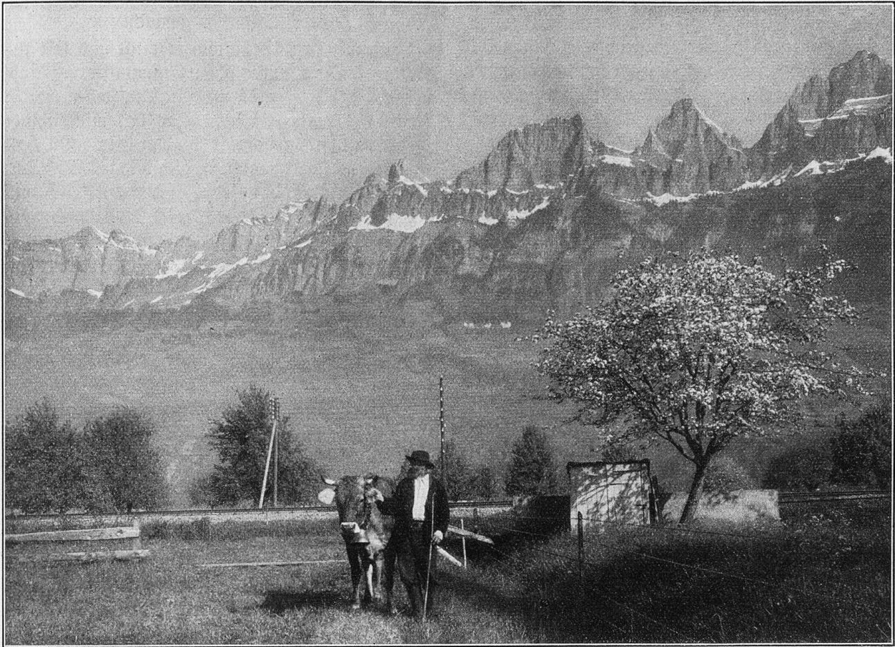
Kurfirften bei Wallenstadt.