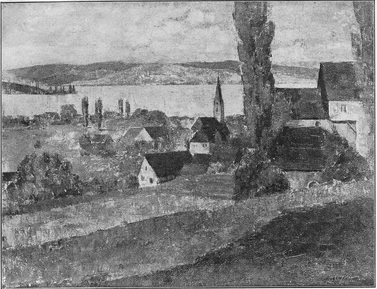
Kurzfriedenbach mit Meersburg.

Nach einem Gemälde von Ernst C. Schaller, Uttwil.