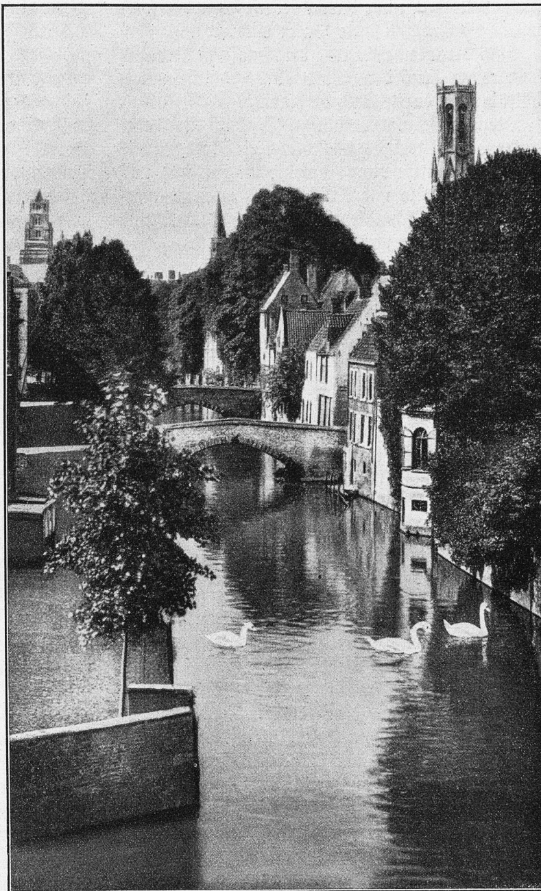
Brücke: Am grünen Quai.

Der Bub nickte ernsthaft, er wollte gleich damit beginnen, aber Vater ließ ihn noch nicht los. „Nein, nicht so stürmisch, du mußt noch ein wenig warten. Mutti schläft jetzt.“ Er schwieg wie erschöpft. Hansi sah erschrocken zu ihm auf. War das sein starker Vater, der Mutti aufhob