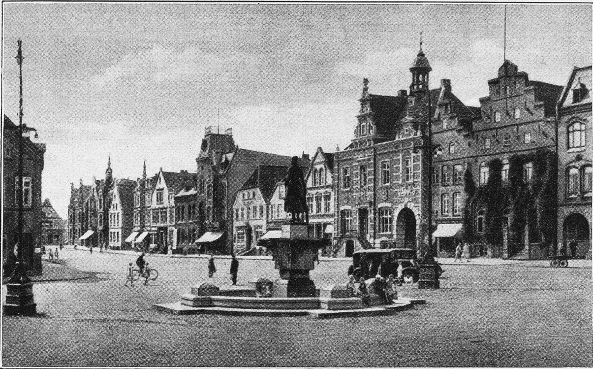
Husum: Markt und Großstraße.

Nebel macht sich breit. Grau ist die Farbe, die vorherrscht, und ein Dunst liegt über den Dächern, der melancholisch machen könnte. So, wie's in Storms Liede lautet, habe ich Husum auch gesehen. Freilich, zuletzt brach doch die Sonne durch und übergieß die alten Giebel mit einem festlichen Glanz.