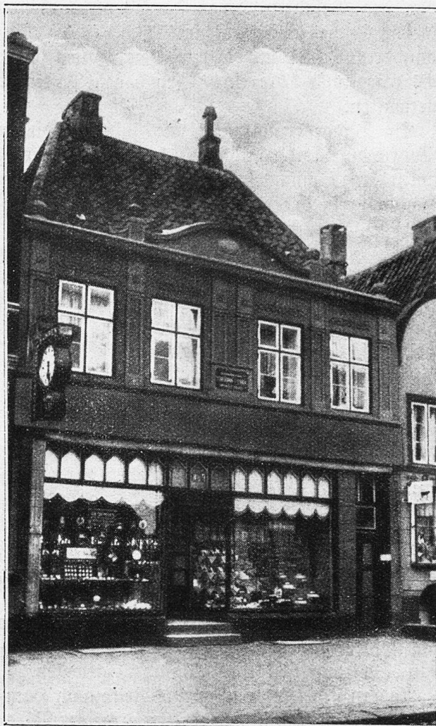
Husum: Geburtshaus Theodor Storms.

Nach dem ermüdenden Gang durch die Stadt, auf dem ich mir nichts entgehen lassen wollte, tat es wohl, eine Fahrt in die Umgebung zu unternehmen. Die Post brachte mich nach der dem Festland vorgelagerten Insel Nordstrand. Ein breiter, ganz neu eröffneter Damm führt hinüber und macht die Fremden bekannt mit den eigenartigen Verhältnissen, wie sie die Halligen bieten. Die eingedeichte Marschinsel, die über 40 Quadratkilometer umfaßt, ist dünn bevölkert. Die einzelnen Höfe liegen weit zerstreut. Es ist eine stille, einsame Welt. Viel Vieh weidet auf dem mageren Gelände. Kornfelder finden sich zwar auch. Da und dort steht eine große Windmühle, die ihre Flügel dreht. Ich habe die Insel durchkreuzt, bis ans andere Ende, wo man hinaus schaut ins Wattenmeer und nach den fernen, scheinbar auf dem Wasser schwimmenden Gehöften. Die Bauern führen dort sozusagen ein amphibisches Dasein. Zur Zeit der Ebbe sind sie streckenweise mit dem Festlande verbunden. Wenn aber die Wasser wieder kommen, werden sie in die Einsamkeit hinaus entrückt, und nur zu Schiff können die entlegenen Nachbarn besucht werden. Da gilt es, immer genau die Zeiten der fliehen-