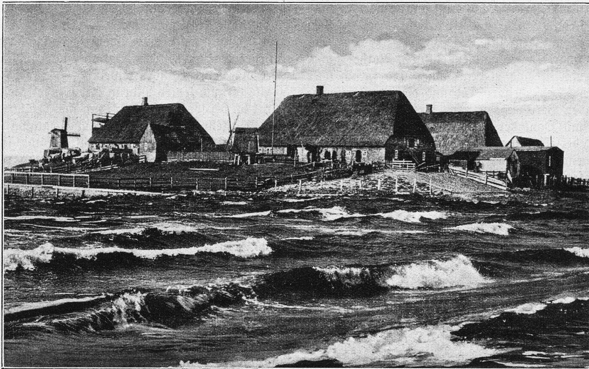
Hallig-Gröde im Sturm.

auf Besuch; dann wurde es lebendig in dem niedrigen Häuschen; Kammern und Herzen, alles voll Sonnenschein. — Aber auch diese jüngere Schwester sollte sie überleben. Als ich auf die Todesnachricht zu ihr ging, fand ich sie eben beschäftigt, aus Schubfächern und Kästchen ihre Barschaft zusammenzusuchen; es sollte heute noch alles an ihren Schwager abgesandt werden, damit — so sagte sie — die Überlebenden außer der Trauer nicht etwa noch mit der kleinen Not des Lebens zu kämpfen hätten.