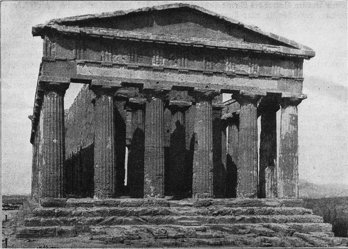
Agrigento. Tempel des Kastor und Pollux.

Wir vergnügten uns an der unendlich mannigfaltigen Aussicht und suchten sie im einzelnen zeichnerisch und malerisch zu entwickeln, denn hier konnte man grenzenlos eine Ernte für den Künstler überschauen.