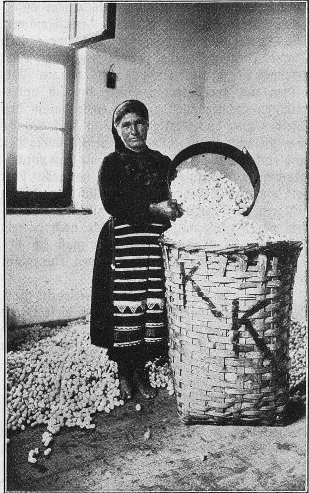
Das Wunder der Seidenraupe. Die Kokons werden zum Versand in Körbe verpackt.

Enlert und Hofprediger Strauß waren mit zugegen. Ebenso der Kronprinz. „Was sagen Sie dazu?“ fragte der König in heiterer Laune, worauf die beiden geistlichen Herren natürlich lächelten. Der Kronprinz aber sagte: „Hampel hat recht.“