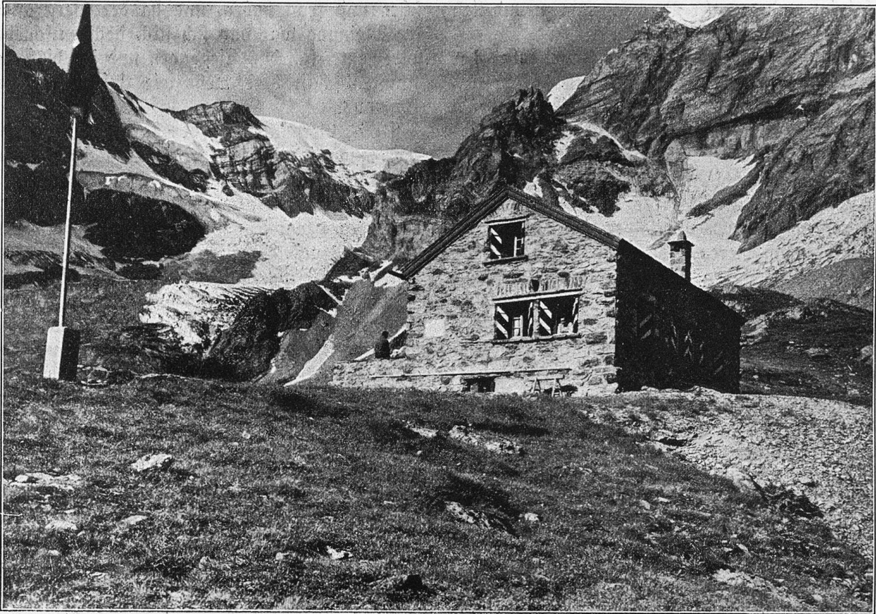
Neue Fridolinshütte des SAC. mit dem Grünhorn, Bündner Tödi und Bifertengletscher.

kein verworfener Stein am Wege, so kommt ein Mensch und schaut und befragt sie, neugierig und unersättlich, wie eben Kinder sind.