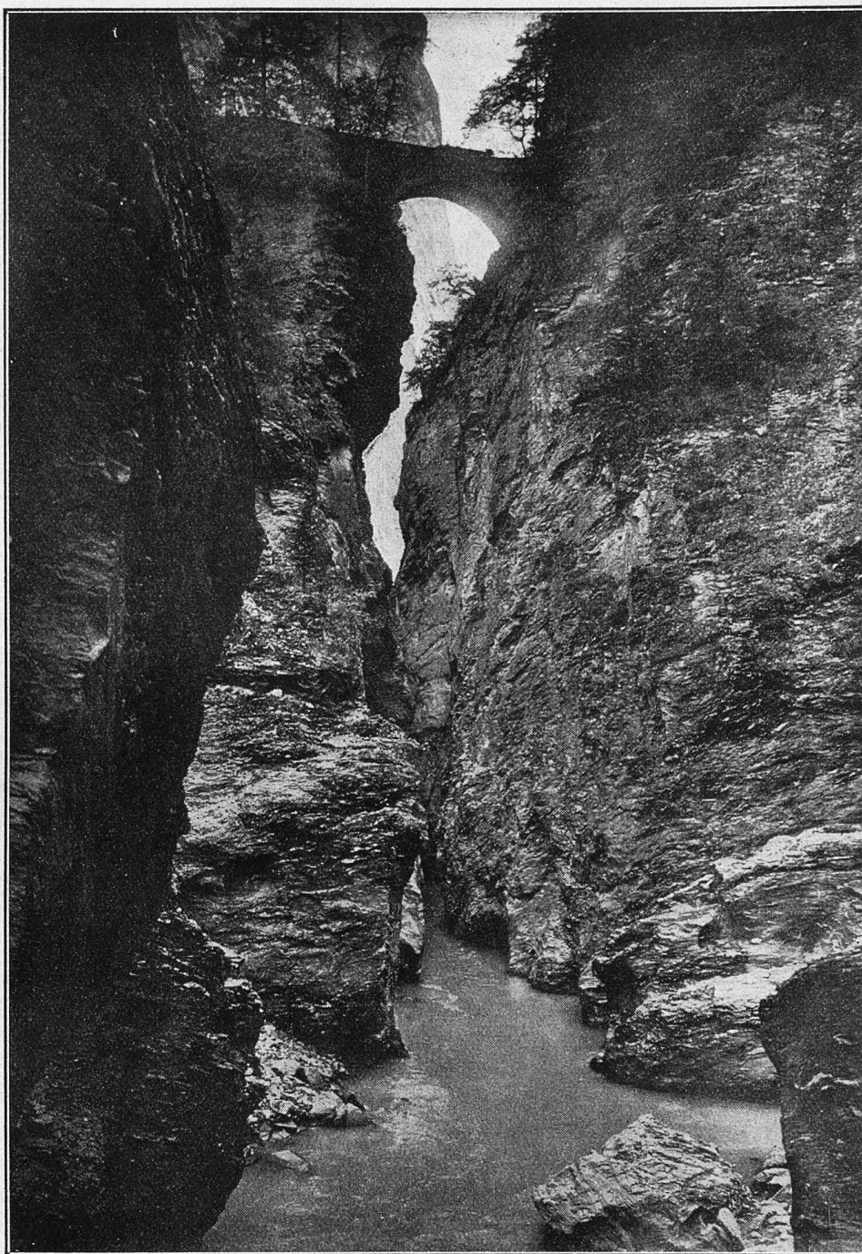
Viamala, zweite Brücke.

Tausendssassa im Handumdrehen: Er versetzte mich alsbald in einen wahren Rausch der Naturfreude und Wissbegier, als er mich mit heiligem Eifer von den Metamorphosen, Eigenheiten und Flugstätten unterrichtete, in ungezählten Schachteln und Kisten seine Raupenzucht vorführte, die Fanggeräte, Spannbretter, Fachbücher sowie die teuflischen Giftfläschchen anschleppte, wovor mich wahrlich ein gerechtes Staunen besiel. Welch eine Welt der Farbe, der Augenfreude, der wunder-