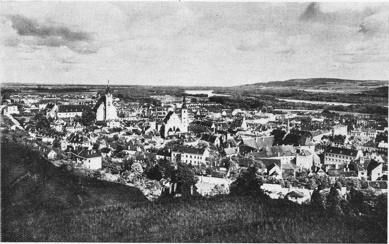
Krems an der Donau.

sen Transportschiffen eingerichtet. Man schaut der Mutter zu, wie sie kocht und Wäsche aufhängt, den Kindern, wie sie spielen. Ihr Heim schwimmt ewig unstät auf den Wassern und wechselt bis ans Ende der Reise ein paarmal die Landesgrenze.