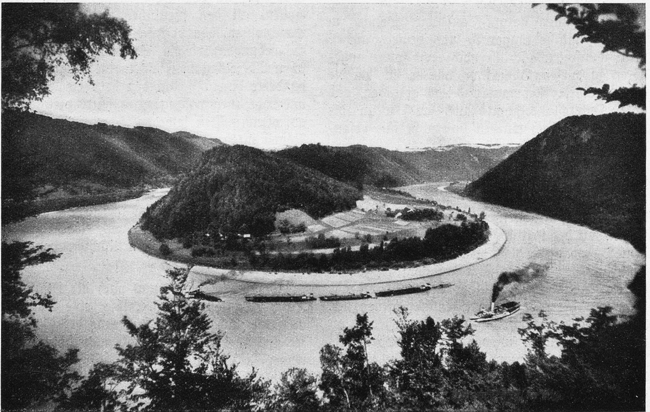
Donauschleife bei Schlägen.

In Oberzell, einer vielbesuchten Sommerfrische am linken Ufer, berührten wir die letzte Station vor Passau. Der Name weist zurück auf